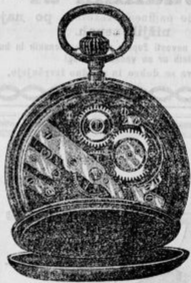
Čeniki s podobami so franko na razpolago.

Tovarniška zaloga pristnih švicarskih izdelkov!