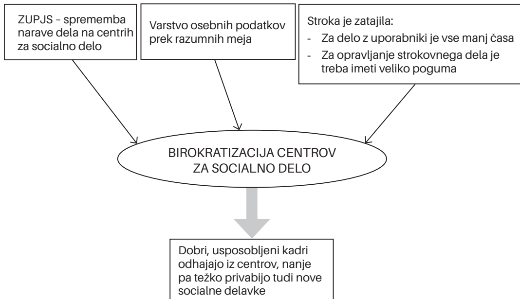
Slika 1: Birokratiziranje centrov za socialno delo.

Pomembna sprememba za centre za socialno delo se je zgodila leta 2012, ko so na centre prenesli odločanje v zvezi s subvencijami stanarin in odločanje o štipendijah. Zaposleni na centrih za socialno delo ugotavljajo, da se je takrat spremenila narava dela, delo pa se od takrat pospešeno birokratizira. Novi Zakon o uveljavljanju pravic iz javnih sredstev (2010) ali ZUPJS pa je pri izračunavanjih otroških dodatkov vnesel tudi spremembo, po kateri otroških dodatkov ne izračunavajo več zgolj na podlagi dohodninske odločbe, pač pa je treba po novem upoštevati celotno premoženjsko stanje vlagatelja, to pa je občutno otežilo in podaljšalo postopke odločanja v zvezi s tem.