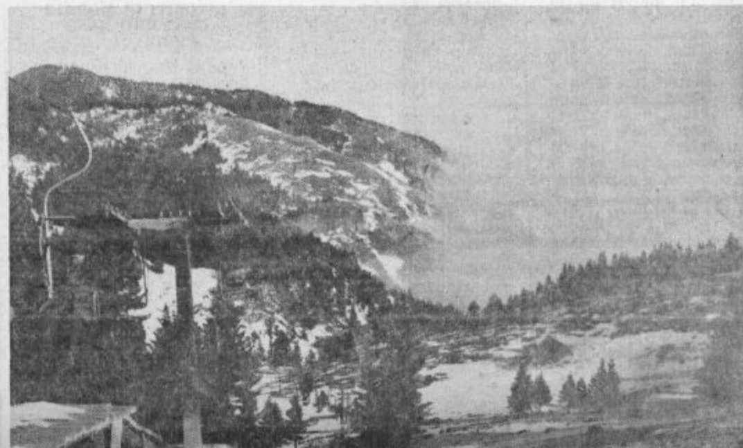
GOLTE VABIJO — Turistični center na Golteh je že v polnem razmahu. Celjski Kompas in Izletnik pa sta pripravila »paket usluge«.