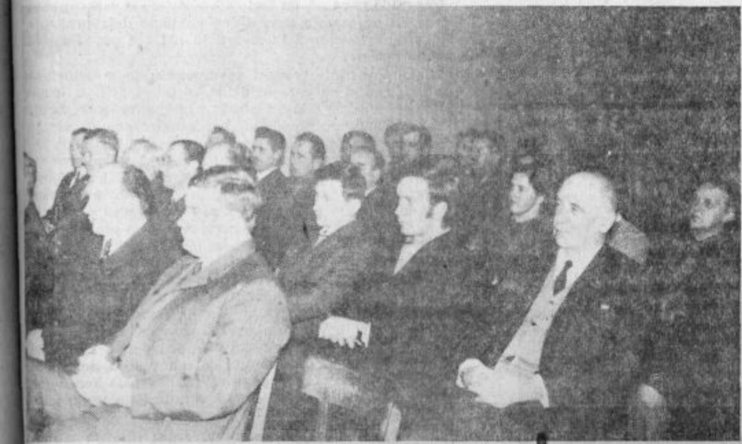
DVAJSET LET DELAVSKEGA SAMOUPRAVLJANJA — V tovarni usnja Soštanj so v 20-letnem samoupravnem obdobju izvolili v samoupravne organe več kot 700 članov delovne skupnosti. Na samoupravnih sejah pa je sodelovalo preko 7 tisoč samoupravljavcev. — Zapis s svečane seje delavskega sveta, ki je bila 20. januarja letos, objavljamo na 3. strani.

Ce v Velenju karnevala res ne bomo videli, potem se lahko jezimo le na turistično društvo.