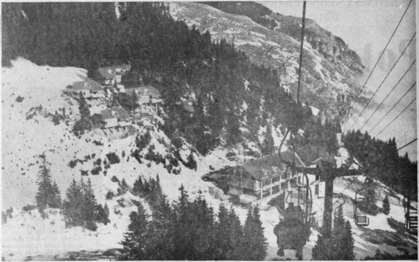
Smučišča na Golteh, sedežnica in v ozadju nov hotel

Gondolska žičnica, sedežnica in vlečnica že redno obratujejo. V zimskem času (do 31. marca) vozi gondolska nihalna žičnica dnevno vsako uro od 7,30 do 18,30. Ob sobotah, nedeljah in praznikih so zadnje vožnje pol ure po polnoči oziroma ob 22,30. Sedežnica in vlečnica pa obratujeta v zimskem času od 8,30 do 16,30. Povratna vozovnica za odraslo