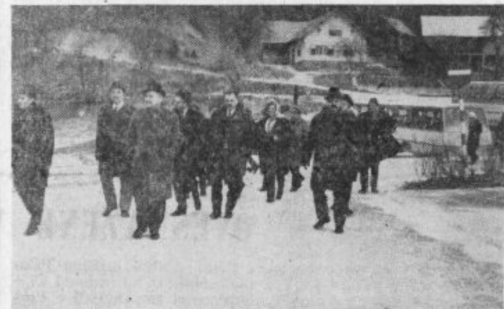
Do Žekovca je udeležence pripeljal Kompasov avtobus