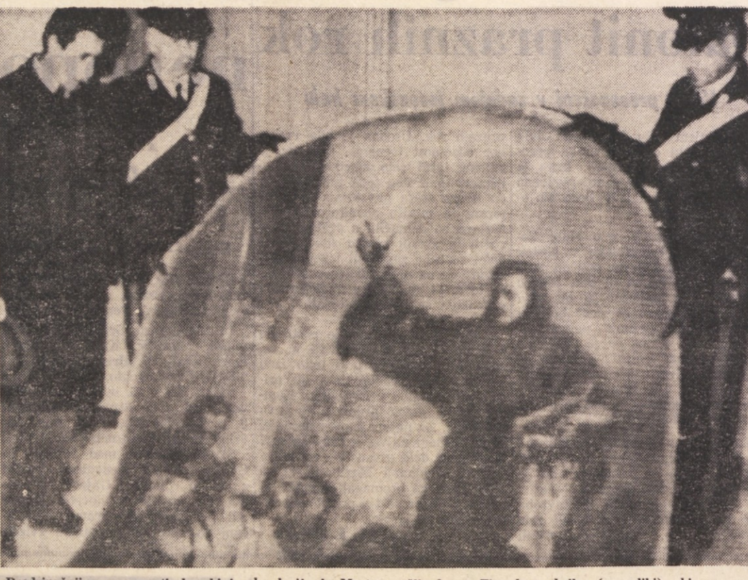
Predsinčnim so agenti karabinjerske legije iz Mester našli slavno Tjepolovo krilo (na sliki), ki so ga neznanec ukradli v noči od 21. na 22. december v domu v Miranu

PARIZ, 27. — Po odkritju terorističnega centra v predmestju Pariza, zaradi česar sedi v francoskih zaporih trinajst prevratnikov, niso se prišli na dan neizpodbitni dokazi, ki bi neovrgljivo dokazovali, da so imeli teroristi v načrtu napad na rimsko letališče Ciampino. Preiskava francoske obveščevalne službe DST je strogo tajna, kljub temu pa v nekaterih pariških krogih vztrajno ponavljajo, da je bil cilj teroristov prav napad na Ciampino. Dokaz za to, trdijo, je dejstvo, da so italijanske oblasti na opozorilo francoskih uvedle na letališču izredne varnostne ukrepe.