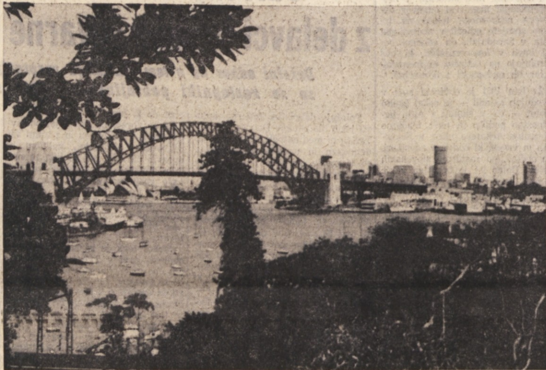
Pogled na Sydney, v ospredju znameniti most

V ponedeljek, 20. avgusta, smo se poslovili od Sydneya in Av- stralije. Po preletu 4.650 kilo- metrov čez avstralsko puščavo ter čez del Indijskega oceana smo pri- stali na letališču Tuban v bližini glavne mesta otoka Bali, Den- passaru. Ob 19.15, po času, ki velja za Sydney, smo preleteli ravn- ino in v imenu kralja Neptuna do- bili diplom o preletu. Potrdilo nam je dalo osebe letala «Boeing 707» avstralske letalske družbe Qantas.