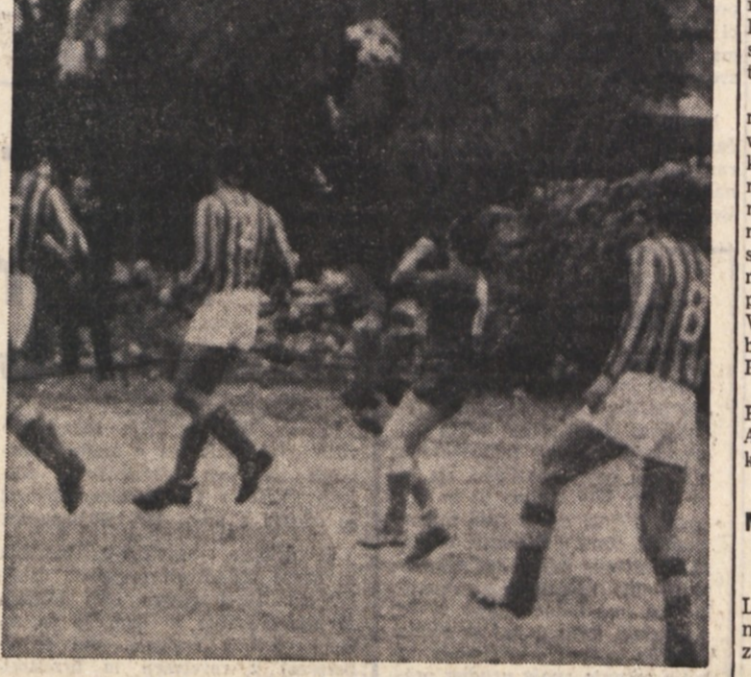
Z nedeljskega derbija 2. AL med Vesno in Primorjem