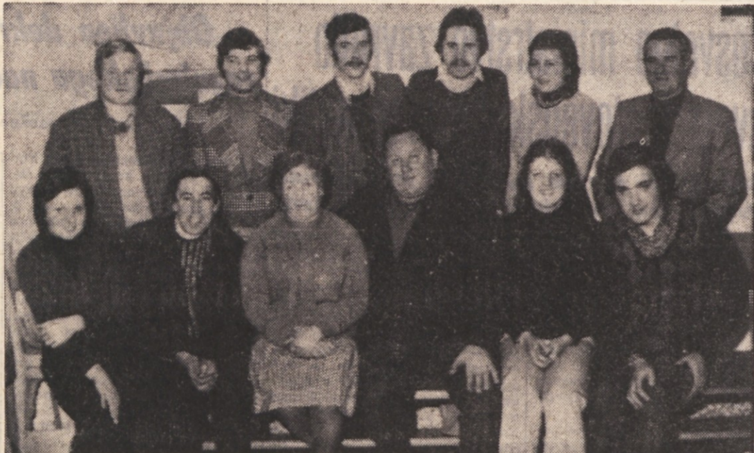
Kakor smo že poročali, so imeli v petek, 21. t. m., v Borštu občni zbor domačega prosvetnega društva «Slovenec». Na občnem zboru je bil izvoljen nov odbor, ki ga vidimo na gornji sliki