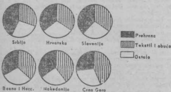
Struktura prometa v nadrobni trgovini v l. 1956

Z nadaljnjo krepitvijo gospodarstva in dviganjem življenjskega standarda moramo pričakovati nove spremembe v strukturi nadrobne trgovine, predosem pa večji delež neživilskih izdelkov v prometu.