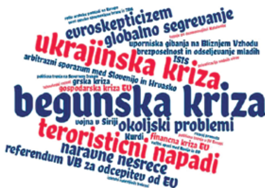
Slika 2: Besedni oblak najpogostejših odgovorov anketirancev na vprašanje o vključevanju konkretnih primerov dnevnih informacij oz. ADPR v pouk RGE v šolskem letu 2015/2016

večini primerov aktualizacij pretežno notranje motivirani (to zaznava 60,0 % anketiranih učiteljev in 72,5 % anketiranih dijakov). V primerjavi z učno obravnavo stalnih učnih vsebin v večji meri dosega tudi cilje vzgoje in izobraževanja za trajnostni razvoj oz. pri večini anketiranih dijakov v večji meri razvija njegove izbrane prvine. V največjem deležu (83,8 %) so anketirani dijaki to ugotovitev podprli pri medijski pismenosti (anketirani učitelji s 40,0 %), v najmanjšem deležu (74,1 %) pa pri aktivnem in odgovornem državljanstvu (anketirani učitelji z 90,0 %), kar nakazuje na razhajanja med zaznavanjem enih in drugih. Vsi anketirani učitelji in slaba polovica anketiranih dijakov (47,5 %) so med primeri ADPR, ki so jih v šolskem letu 2015/2016 vključili v pouk RGE, navedli begunsko krizo, ob njej pa so odgovori najpogosteje omenjali tudi: ukrajinsko krizo, aktualne teroristične napade in naravne nesreče, naraščajoč evroskepticism, dnevne novice o evropskih okoljskih problemih ter političnem dogajanju v EU, vojni v Siriji in uporniških gibanjih na Bližnjem vzhodu ter gospodarsko krizo EU.