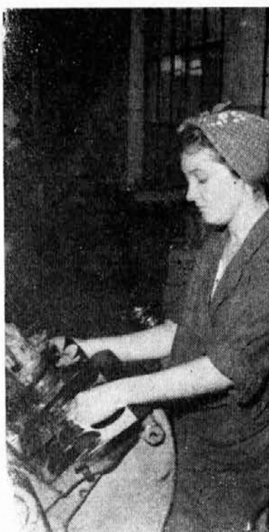
Delo na stiskalnici ne zahteva samo pridnih rok, ampak tudi skrajno previdnost in budnost. Zato prihajaj na delo spočit in svež, da ne bo nesreče!

Zal, da nam niso pri roki podatki, koliko je bilo v tem času zakonov razvezanih ali ponovnih sklepanj zakonske zveze.