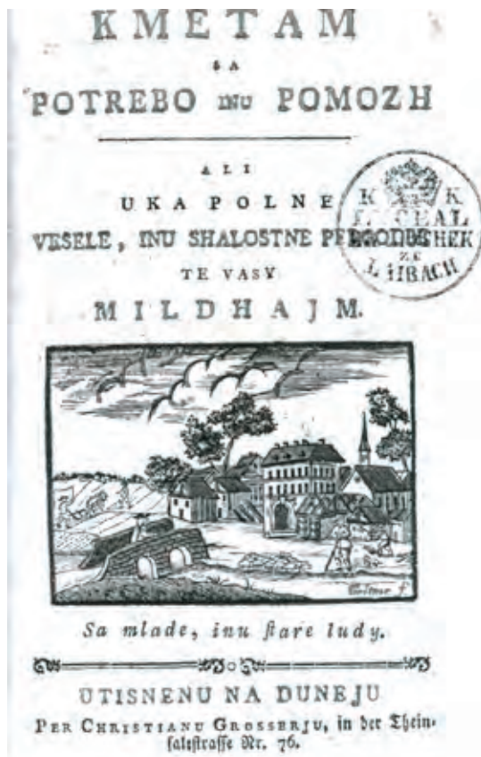
Naslovnica knjige Kmetam sa potrebo inu pomozh , 1789