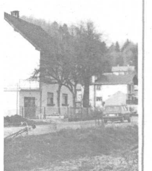
Notranje Gorice: Kdaj boljša voda in varnejše ceste?