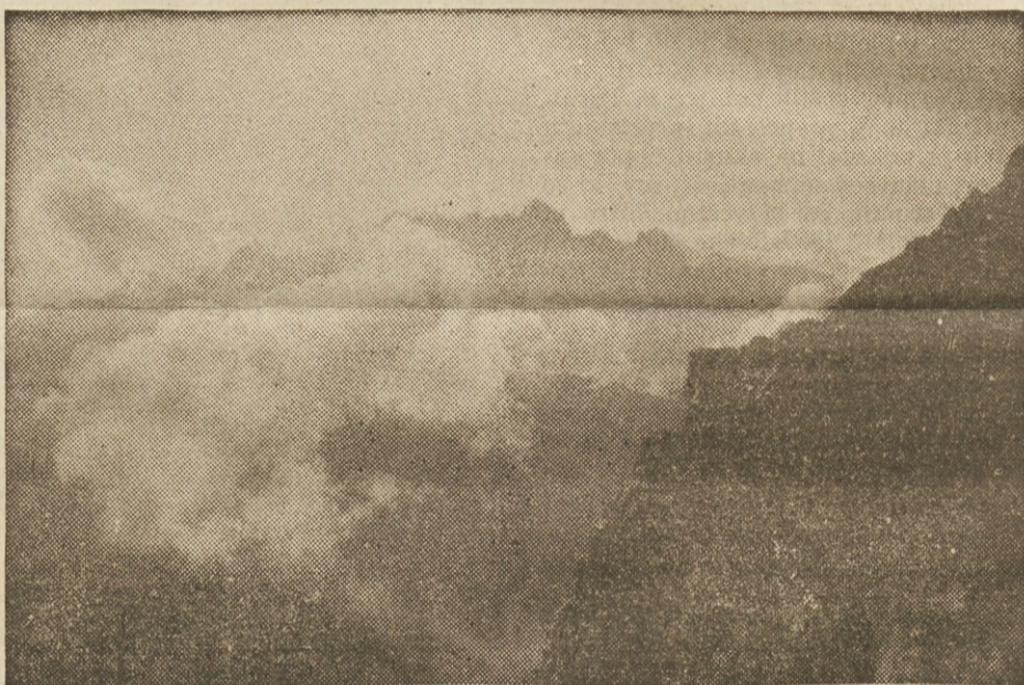
Na visoki Rateški Pond

Vsesplošno ljudsko tekmovanje za fizikalni znak pod geslom »Za republiko naprej« (ZREN), mora do temelja razgibati tudi vrste slovenskih gornikov. Če smo v stanju doprinesiti vrhunske činite v zasneženih stenah, kjer vladata sneg in mraz, če se ne plašimo prepadov in preves v naših težko pristopnih stenah in če s pesmijo korakamo preko zasneženih vrhov naših gora, moremo s ponosom in z vso borbena zavestjo pristopiti k temu vsenarodnemu tekmovanju.