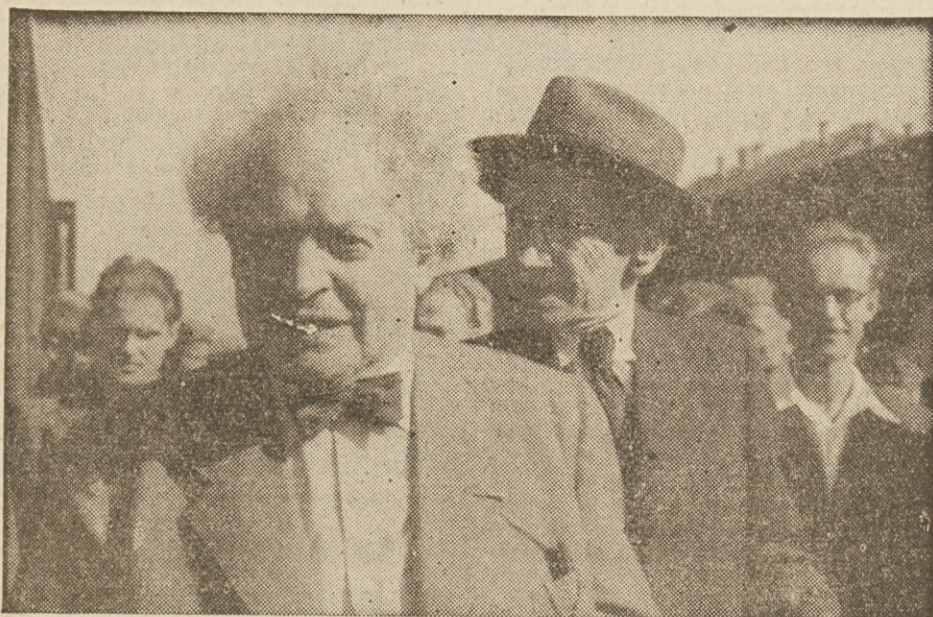
M. A. Nexö ob prihodu v Ljubljano — M. A. Nexö odhaja s kolodvora v spremstvu Otona Župančiča in drugih kulturnikov ter novinarjev