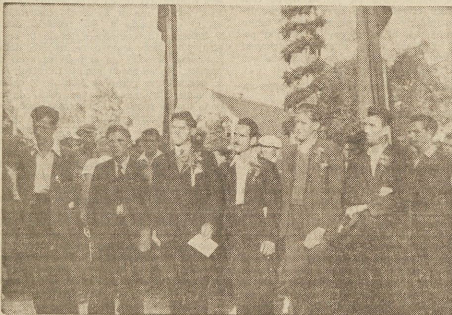
Novi udarniki, proglašeni zaradi požrtvovalnega dela na cesti Ljubljana-Jeziča

Štiri km dolga cesta Ljubljana-Jeziča je odprta in izročena prometu.