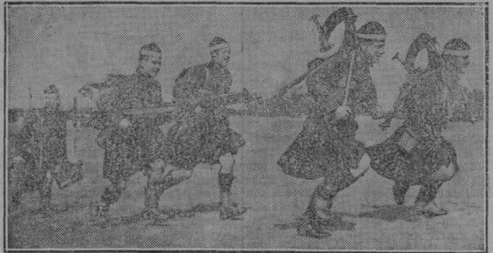
Iz angleških manevrov: hiter pohod s strojnico.

stev ter par desek in pričela z vožnjo po vodi, ki je ostala od povodnji med Metljami in Topolom. Voda je dosegla po mestih globočino 2-5 m. Zakaj in kako se je zgodilo, ne zna nihče, a Ton- ček je menda iz strahu pred preveč glo- bokim skočil v vodo in hotel preplavati do brega. Seveda je otrok utonil in Ve- rica je pričela vpiti na pomoč. Na vpitje