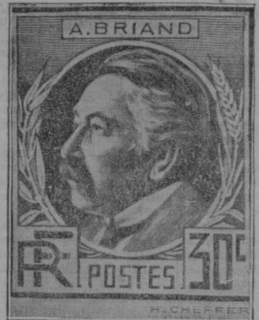
Francija je dobila nove poštne znamke. Na levi vidimo bivšega in umorjene- ga predsednika Doumerja, na desni znamenitega zunanjega ministra Brianda.