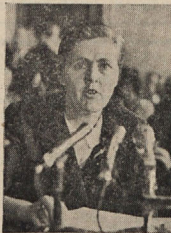
Gospa dr. Frances O. Kelsey na ameriškem preiskovalnem inštitutu za živila pri zasedanju ameriškega senata. Lani jo je predsednik Kennedy odlikoval z visokim odlikovanjem civilne službe, ker je odklonila Thalidomid za Združene države Amerike in s tem preprečila številne spačene porode.

Ne bo manjkalo patetičnih posmrtnic, pri katerih človek Oskar Helmer ne bo našel prave ocene. »Če smo tudi stali v različnih političnih taborih, potem nas je v dobrih in budih dneh vendar ljubezen do domovine in skrb za bodočnost avstrijskega ljudstva vodila skupaj«, je zapisal Julij Raab, ki mu Helmer ni bil samo koalicijski partner, temveč tudi sodelavec, sodelatelj in prijatelj. Oskar Helmer je bil več kot politik, bil je državnik, ki je imel vedno pred očmi dobrobit človeka in javnosti, ki ni mislil samo na naslednje volitve, temveč na naslednje rodove. Delovanje državnika Oskarja Helmerja ostane neolčljivo s preteklostjo in prihodnostjo Avstrije.