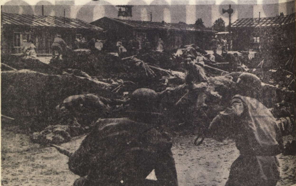
Prizor iz italijanskega filma "Kapò", ki bo na mednarodnem beneškem filmskem festivalu prikazan izven konkurence...