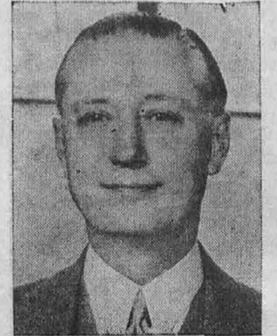
Gov. Martin L. Davey