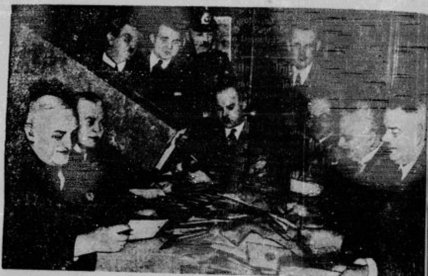
P. znananih volitvah v Nemčiji. Tako sliko je nudil 5. marca zvečer po vseh volilnicah Nemačija se je tokrat udeležilo skoro 40 milijonov prebivalstva volitev. Radi tolikega števila glasov je bilo izredno veliko dela, tembolj v Prusiji, kjer so se vršile volitve za državni in deželni svet.