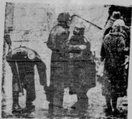
Velika policijska racija v Berlinu. V Köslinski ulici v Berlinu je 300 policijskih uradnikov zaprlo cel blok hiš, nakar so napravili sistematične hišne preiskave vseh hiš; pred vsem so iskali komunističnega orožja. Tudi po ulici so mimoidože preiskavali.