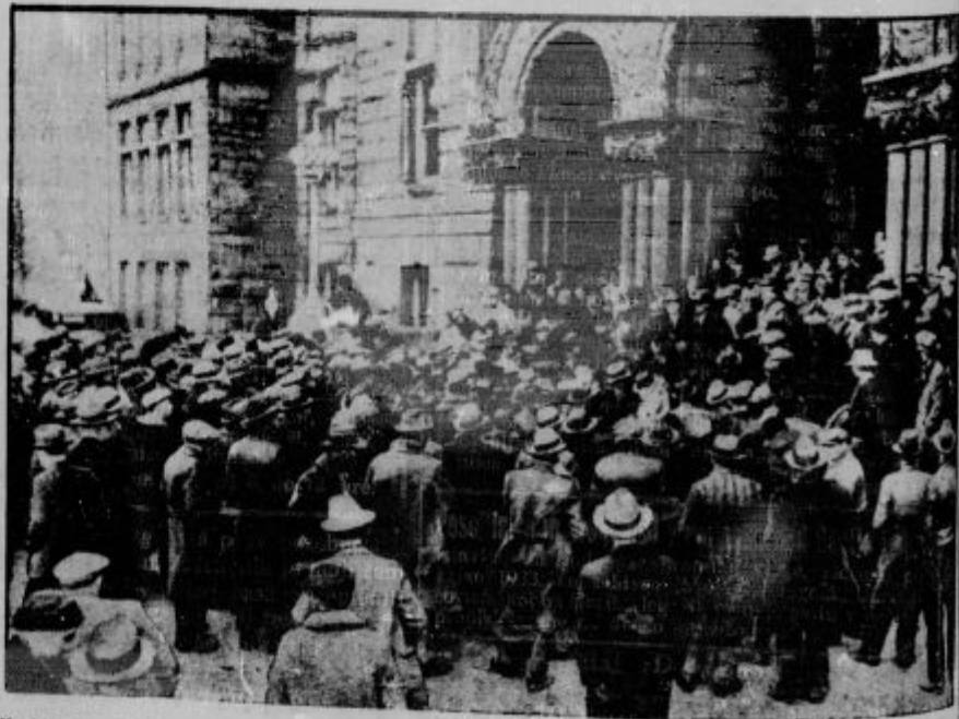
Naokoli na banke v Ameriki. Šele solzne bombe so razgnale ljudi, ki so hoteli dvigniti svoj deseti odstotek.