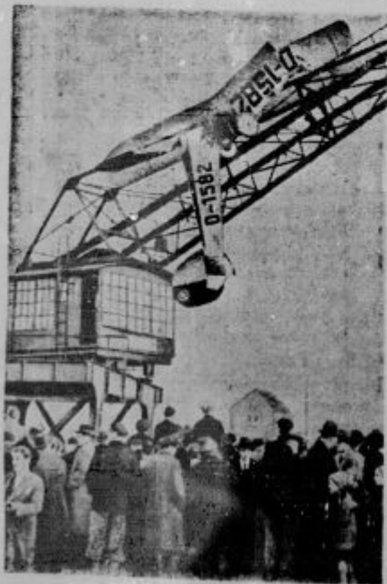
V severni berlinski luki je padlo propagandno letalo narodnih socializtov na srednji del žerjave, nakar se je letalo v sredi prelomilo. Za čudo pa je ostal pilot nepoškodovan.