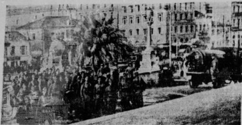
K revoluciji na Grškem, vojaštvo je zasedlo akademski trg v Atenah, kjer se je odigrala revolucija. Na sliki se vidi resna škornilnica, iz katere so brizgali vodo na vročekrvne demonstrante.