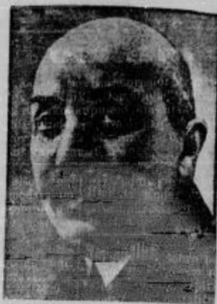
Caldaris, načelnik monarhistične stranke, ki je zmagala pri zadnjih volitvah. S pomočjo generala Kondilisa je Caldaris zrušil diktaturo nizelosovega prijatelja generala Plastirasa in postal sam ministrski predsednik.