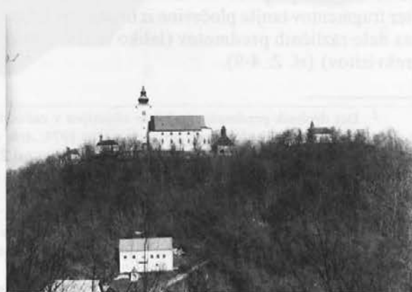
Sl. 1: Svete Gore. Pogled z vzhoda.

ni dejavniki in gradbena dela od rimskega časa dalje do zdaj nenehno preoblikovala in so se tako na njem zabrisale številne sledi življenja iz sta-