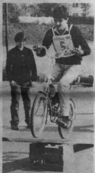
Sicer pa je spretnostna vožnja pokazala, da nekateri prav zares obvladajo poni kolesa, saj so spretno krmarili med keglij, prepeljali brv, dokazovali obvladovanje počasne vožnje, zapeljali skozi predor in prenašali žogico z enega mesta na drugo. Za to vožnjo je bilo treba seveda precej treninga, znanje pa bo verjetno osnovnošolcem koristilo tudi v vsakdanjem prometnem labirintu.

Konec dober, vse dobro, bi lahko zapisali, saj so na koncu vendarle uspeli izračunati rezultate, razdeliti medalje in pokale, čeprav lahko dodamo, da bi bilo treba tekmovalje, ki zahtevajo veliko predpriprav udeležencev, na katerem vsakdo vlaga vse svoje znanje in moči, prav zaradi pionirjev in pionirk, ki tekmujejo, bolje organizirati.