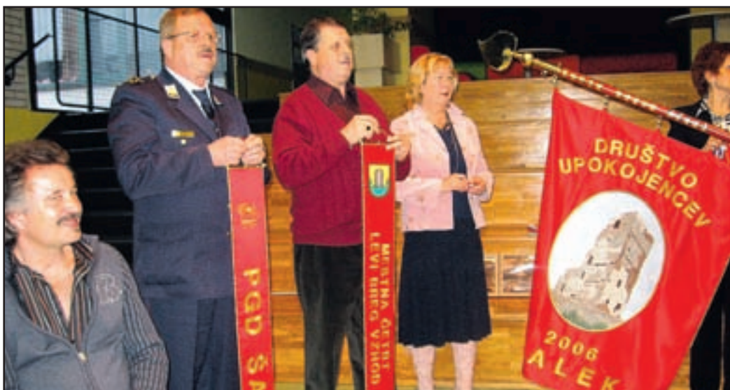
Za simbol na novem praporu so si upokojenci Šaleka izbrali Šaleški grad. Razvili so ga na odlično obiskanem drugem rednem letnem občnem zboru.