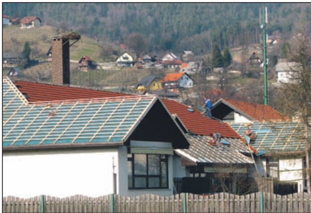
V vrtcu ne bo več zamakalo.