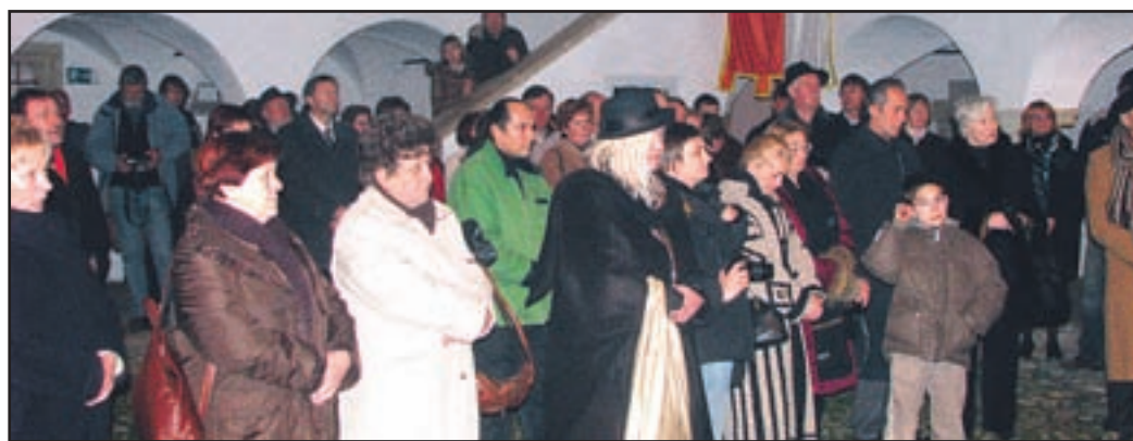
V mrzlem večeru se je v atriju Velenjskega gradu na otvoritvi kiparske razstave, ki je nastajala kar 5 let, zbralo veliko avtorjev in ljubiteljev umetnosti. Razstavljavcem so tudi čestitali in jim podarili cvet.