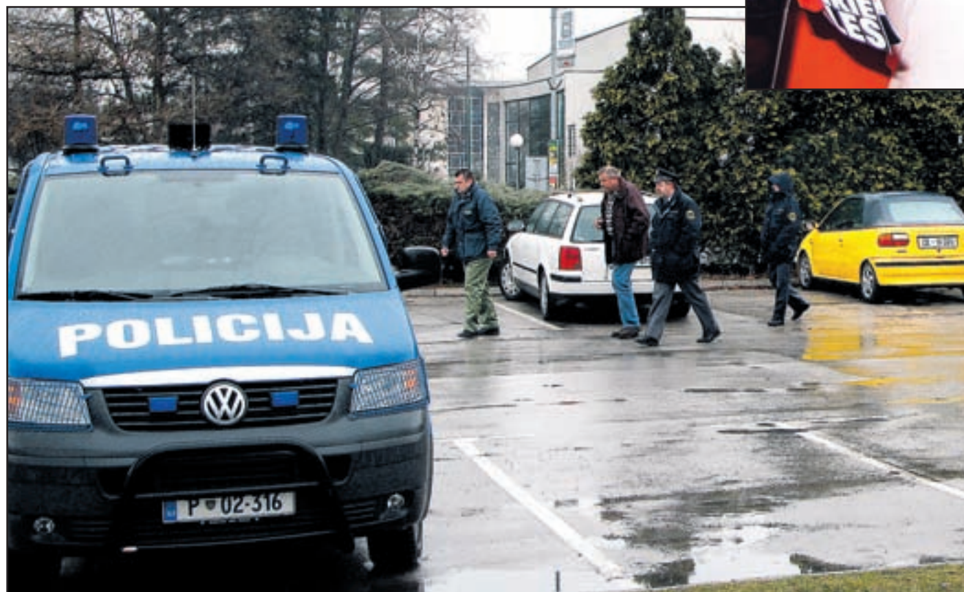
Na parkirišču ob Šaleški cesti je bilo v soboto zjutraj polno policistov.