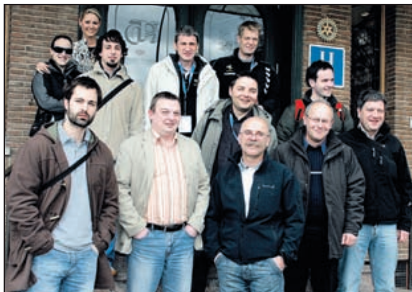
Del navijačev: maloštevilni, a glasni.