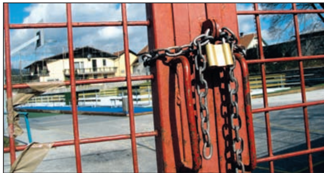
Rokometno igrišče zdaj sameva, kmalu pa bodo začeli obnovo. Potreben denar so dobili iz Fundacije za šport.