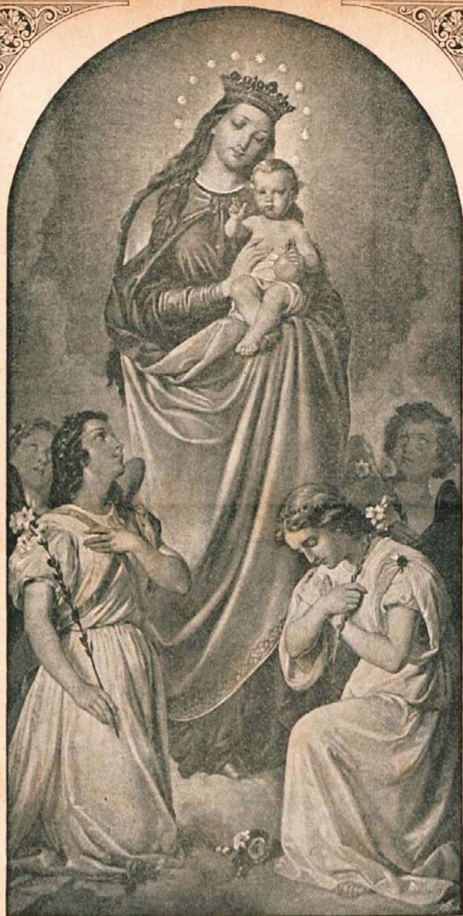
Podoba Marije, Pomoči kristijanov, v kapeli Marijaniški.