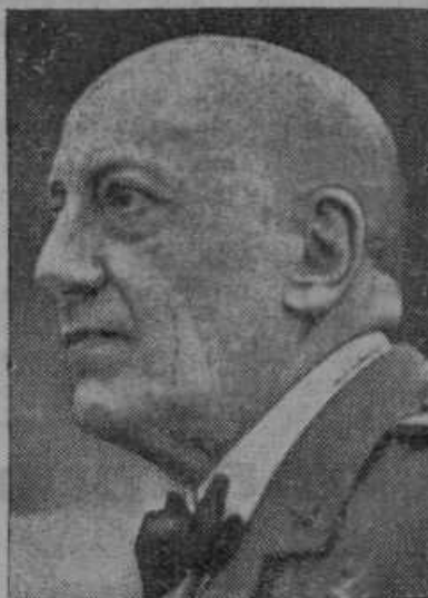
Gabriele D'Annunzio, italijanski pesnik in politik, je bil po smrti iznajditelja Marconija od Mussolinija imenovan za predsednika kraljevske italijanske akademije.

tako naglašajo angleški katoliški nadškof, »nam je bilo jasno, da ne gre v Španiji le za kako državljansko vojno v priloge kake dinastije ali kakega režima, in še manj, kar se je varljivo poudarjalo, za demokracijo španskega naroda. Požar na španskem polotoku je bil podtaknjen od onih, ki hočejo ves svet zajeti v plamene revolucije, pri čemer je krščanska kultura obsojena na pogin. Ni samo katolicizem, ampak vera sploh je glavni cilj napadov brezbožnih sil, ki so Španijo izbrale za tisto strateško točko, iz katere so hotele zažgati svetovno revolucijo v vsej civilizirani Evropi. Z bolečino, ki jo presega samo bol španskih katoličanov in njihovih škofov, smo morali gledati pohod laži, zavijanj in lažnivih razlag dejstev, ki se dogajajo v Španiji. Žal, da se je tudi angleški tisk le prerad dal vplivati dobro plačani boljševiški propagandi. Vaše besede so prinesle jasnost v temo negotovosti, ki je razprostrta nad vsem, kar se dogaja v Španiji. Vi ste doprinesli dokaz, da se protikrščanski duh na življenje in smrt bori proti Kristusovi veri in proti krščanski kulturi. S tem ste zlonamerno poročanje tajnih mednarodnih sil osvetlili kot lažnivo protikrščansko propagando. Upamo,« tako zaključuje angleški nadškof svoje pismo, »da bo Vaše pisanje odprlo