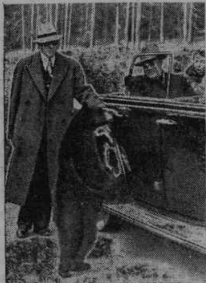
Pril avtovožnji skozi Yellowstone narodni park v Severni Ameriki je prišel pozdravit radovedni medved predsednika Združenih ameriških držav Roosevelta in njegovo soprogo.

Za kaj gre v Španiji? Španski škofje so izdali pastirsko pismo, ki pojasnjuje prave razloge, iz katerih je vznikla državljanska vojna. Pismo je vzbudilo silno zanimanje po vesoljnem svetu, ker govori iz njega beseda najbolj pristojnih in nepristranskih činiteljev. Z raznih strani so prišli španskim škofom priznalni in zahvalni odgovori. Pariški nadškof kardinal Verdier je poslal toledskemu nadškofu kardinalu Goma Y. Thomasu pismo, v katerem poudarja veliko uslugo, ki jo skazujejo španski škofje vsem narodom s tem, da v luči dogodkov prikazujejo, kam vodi dejansko brezboštvo, propad npravnosti, slabljenje ugleda oblasti in ljubimkanje vlad s temi nauki. To vodi v propad in smrt. Je to izredno koristen nauk, ki ga dajejo drugim. Popolnoma jasno je, da je silna borba, ki danes napaja s krvjo zemljo katoliške Španije, v resnici borba med krščansko kulturo in sovjetskim brezboštvom. Bodoča Španija bo venčana s slavo mučencev in mnogih junakov ter bo lepša, kakor je bila kdajkoli v zgodovini. Toledskemu kardinalu je tudi prišlo pismo iz Anglije, pisano od westminsterskega nadškofa Hinsleyja. »Od vsega početka,«