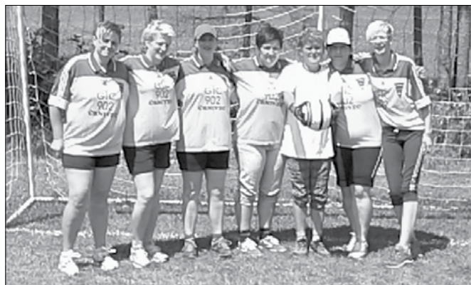
Največ spodbujanja je bila deležna ženska ekipa, ki se je uvrstila v zlato sredino.