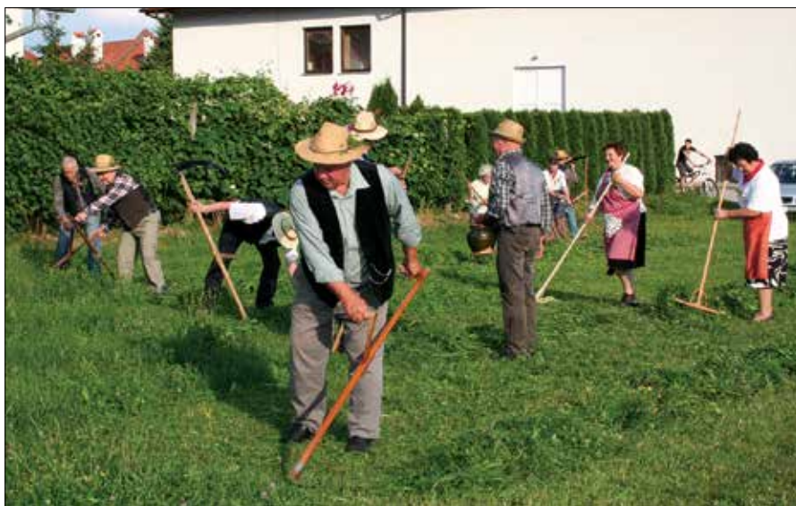
Za kosci so se v vrsti na delo podale še grabljice.