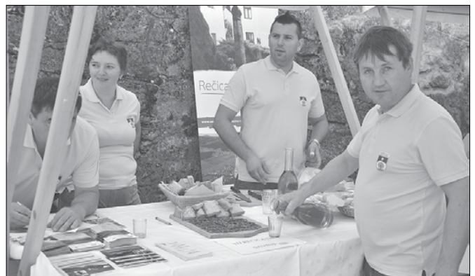
Člani Turističnega društva Rečica ob Savinji so na svoji stojnici v Pilštanju ponujali tovekce, želoдец, kruh iz krušne peči in štraube.