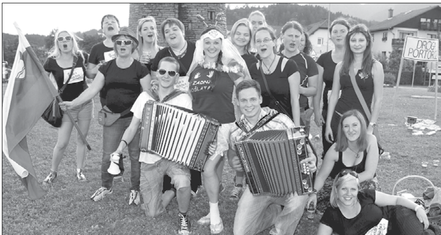
Razposajena dekliska družba je sredi krožišča zbujala pozornost mimovozečih.