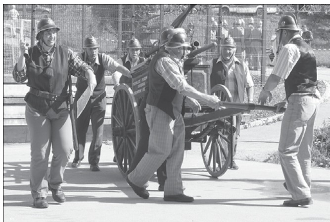
Ekipa PGD Gornji Grad je pripeljala ročno brizgalno z letnico izdelave 1886.

Ekipi domačink, ki je izven konkurence nastopila kot prva, je brizgalna iz leta 1925 zatajila, vse naslednje ekipe pa so uspešno izpeljale vajo. Veterani so v povprečju šteli 60 let. Najstarejši