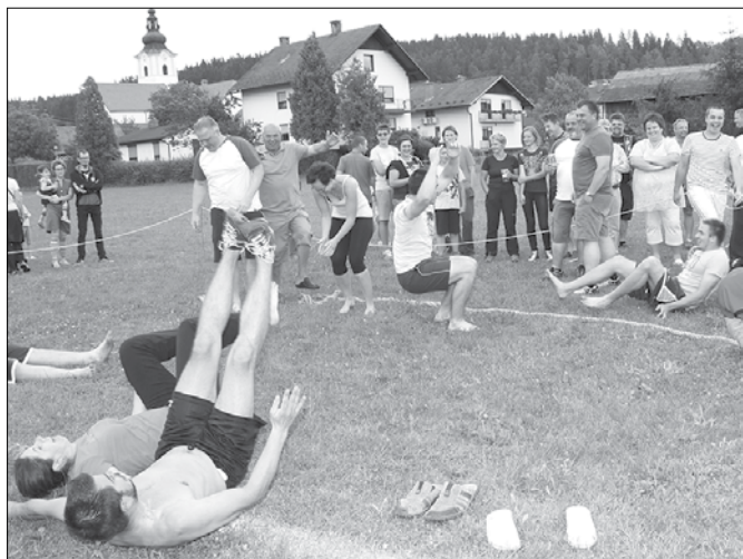
Vesele ob zmagi v vlečenju »štrika« je bilo v ekipi Pobrežij nepopisno.

Zadnja nedelja v juniju je bila na Rečici ob Savinji rezervirana za sprostitve ob šaljivih igrah med zaselki v občini. Tradicionalni športno-družabni dogodek je pripravilo rečiško turistično društvo v sklopu 35. prireditve Od lipe do prangerja, na koncu pa so bili najbolj med vsemi veseli Pobrežani.