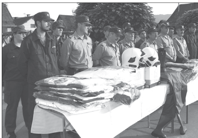
Gasilci rečiške občine so bogatejši za opremo v vrednosti nekaj več kot 12 tisoč evrov.