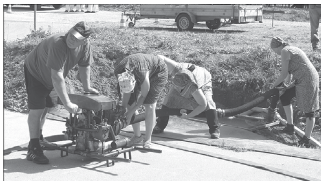
Radmirčankam je pri njihovem nastopu ponagajala tehnika.

med moškimi je štel častitljivih 90 let, najstarejša gasilka je imela 70 let. Ekipi iz Gornjega Grada in Vranskega sta s seboj pripeljali najstarejši ročni brizgalni, katerih leto izdelave sega v leto 1886. Tekmovali so gasilci in gasilke iz Radmirja, Topolšice, Gornjega Grada, Vranskega, Paške vasi, Pobrežij ob Savinji, Kaple Pondor pri Taboru in iz Gotovelj.