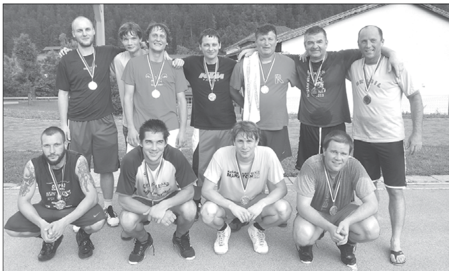
Najboljše tri ekipe so prejele medalje.