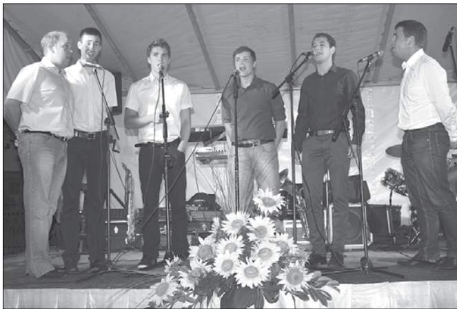
Klapa Sidro iz Lukovice je Rečičanom pripravila pester program dalmatinskih pesmi in narodnih napevov.

Z večerom pod trško lipo so 5. julija na Rečici ob Savinji sklenili sklop prireditev v okviru 35. prireditve Od lipe do prangerja. Tokrat so se v kulturnem programu predstavili pevci Klape Sidro iz Lukovice.