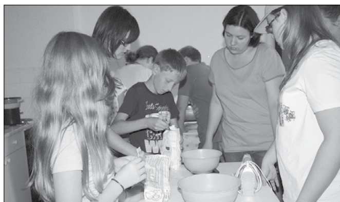
Del aktivnosti udeležencev oratorija so bile ustvarjalne delavnice.