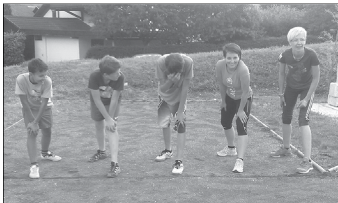
Na atletskem četverboju so se tekmovalci pomerili tudi v dveh tekaških disciplinah.