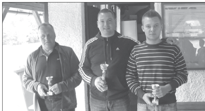
Prvi trije na tekmovanju v streljanju z malokalibrsko puško.