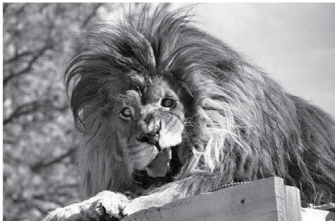
Takole zgleda tip, ki je prekrokal povolilno noč, ko so zmagali levi na volitvah.

Preko vikenda smo imeli volilni molk, v ponedeljek pa do ponovitve finalne tekme v svetovnem prvenstvu nogometni molk. Nihče ni smel niti pisniti o rezultatu, dokler si nismo ogledali ponovitve tekme, saj je bila redna prepozno na televiziji za naš hišni red.