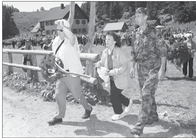
Delegacija Združenja borci za vrednote NOB Mozirje je položila venec k spomeniku padlim borci na Menini.