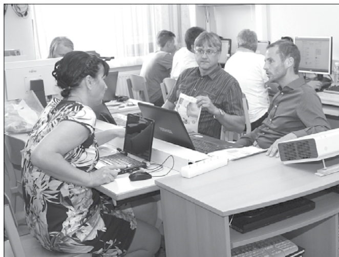
Delavnica v nazarski osnovni šoli je bila zelo dobro obiskana.

Občina Nazarje in podjetje PriMS sta pred kratkim v Nazarjah organizirala delavnico o spletnem komuniciranju. Organizatorja sta namreč za občane odprla nov medijski kanal na spletnih straneh MojaObcina.si.