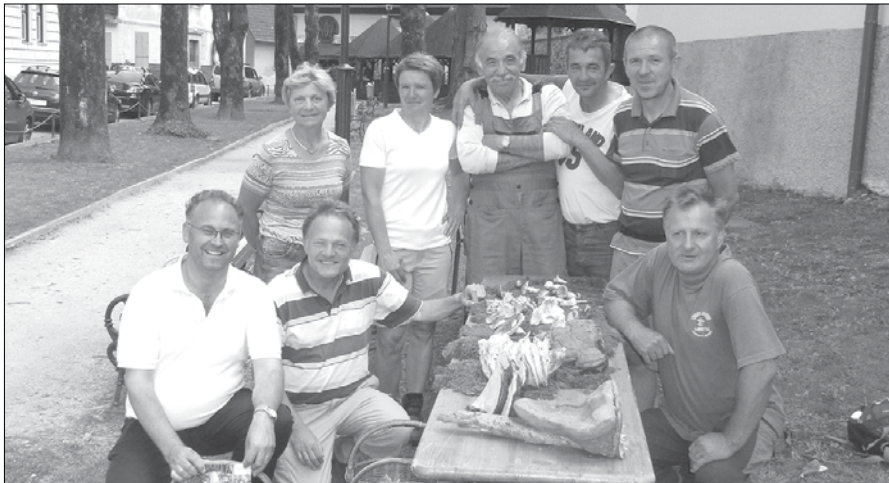
Mini razstava gob in degustacija pašete v parku pred posojilnico.