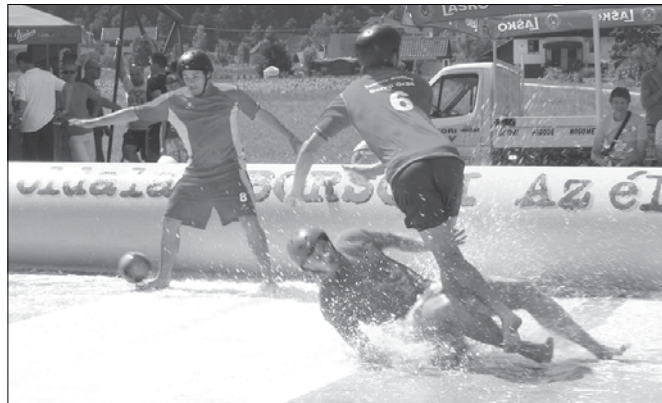
Nogometnih akcij s spektakularnimi padci ni manjkalo.