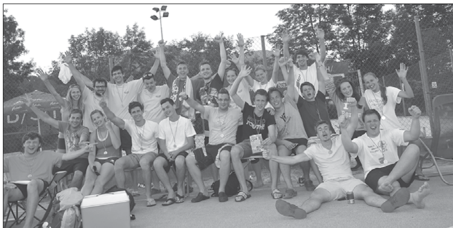
Odbojarski maratonci po 24 urah - utrujeni vendar nasmejani in zadovoljni.

Po Colnarič-Žunterjevem memorialu v malem nogometu in odprtem prvenstvu občine v balinanju so v športnem društvu Gmajna svoje prireditev ob občinskem prazniku zaključili s 24-urnim maratonom v odbojki na mivki.