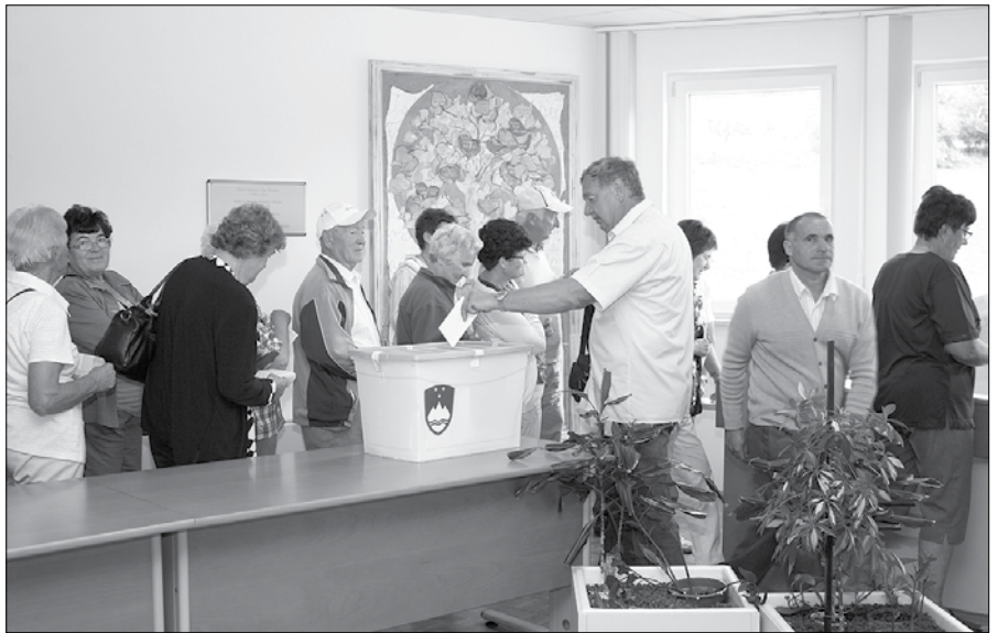
Člani društva invalidov na predčasnem glasovanju

Čeprav je bil na voliščih v Zgornji Savinjski dolini, kjer je s svojimi kandidati tekmovalo 14 strank, odstotek glasov za SMC nekoliko nižji od nacionalnega povprečja, je ta z 28,63