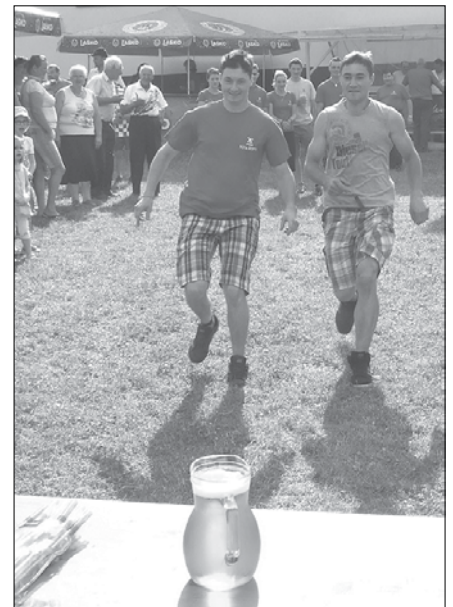
Ker so vaške igre potekale pod okriljem PGD Nova Štifta, so se navezovale na to, kaj počnejo gasilci.

Organizatorji so tekmovalcem pripravili vno igro in potem prikaz, kako se zabava na gasilskih veselnicah; morali so peti in plesati, spremljal jih je ansambel Mika Nas. Tekmovalci so skakali v žakljih, moški pa so morali pokazati, koliko poslušajo ženske, saj so jih morali z vezanimi očmi peljati v samokolnici skozi ovire. Nazadnje so se trudili zadeti čim več obročkov na palico.