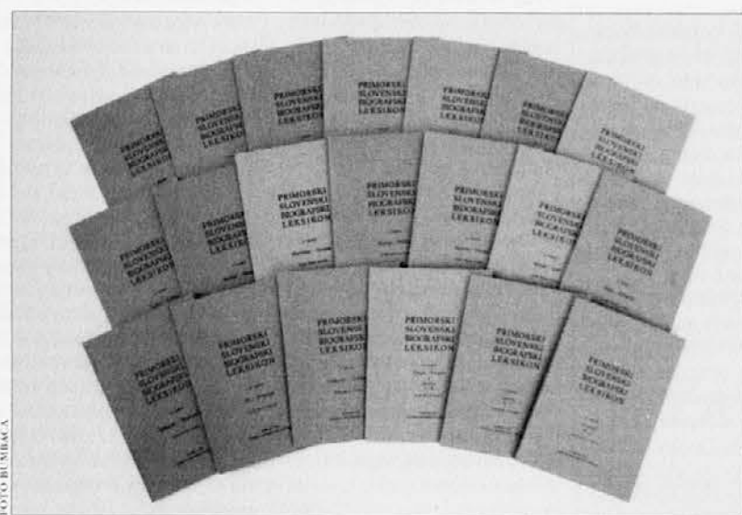
PRIMORSKI SLOVENSKI BIOGRAFSKI LEKSIKON Cel komplet od 1. do 20. snopiča - 60,00 €

ZELO UGODEN NAKUP KNJIG GORIŠKE MOHORJEVE DRUŽBE CENE ZNIŽANE OD 20 DO 75%