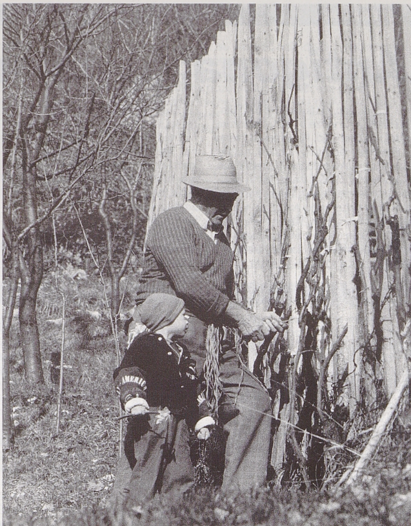
Učna ura (foto Ivan Strmole, nagrajen na fotografskem natečaju Mladike).

To dogajanje o Internetu me zelo spominja na Ezopovo basen o gori in miški. Kljub temu pa je le prinesla vsaj kaj koristnega. Upam, da se vse to ne bo izjalovilo, da bomo vzklikali (če parafraziramo neki znan rek): "Internet je mrtev. Naj živi Internet!"