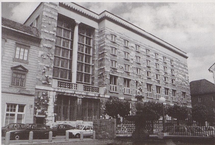
Narodna in univerzitetna knjižnica v Ljubljani.