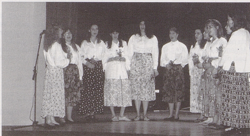
Mladinska pevska skupina v Marijinem domu v Rojanu ob 30-letnici slovenske liturgije.

Jenu taku se je šluo naprej dva doluga ljeta, dukr nejsjo spelali uede du te naše zakuetne vasi.