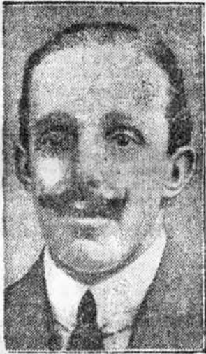
Španski kralj Alfonz XIII.