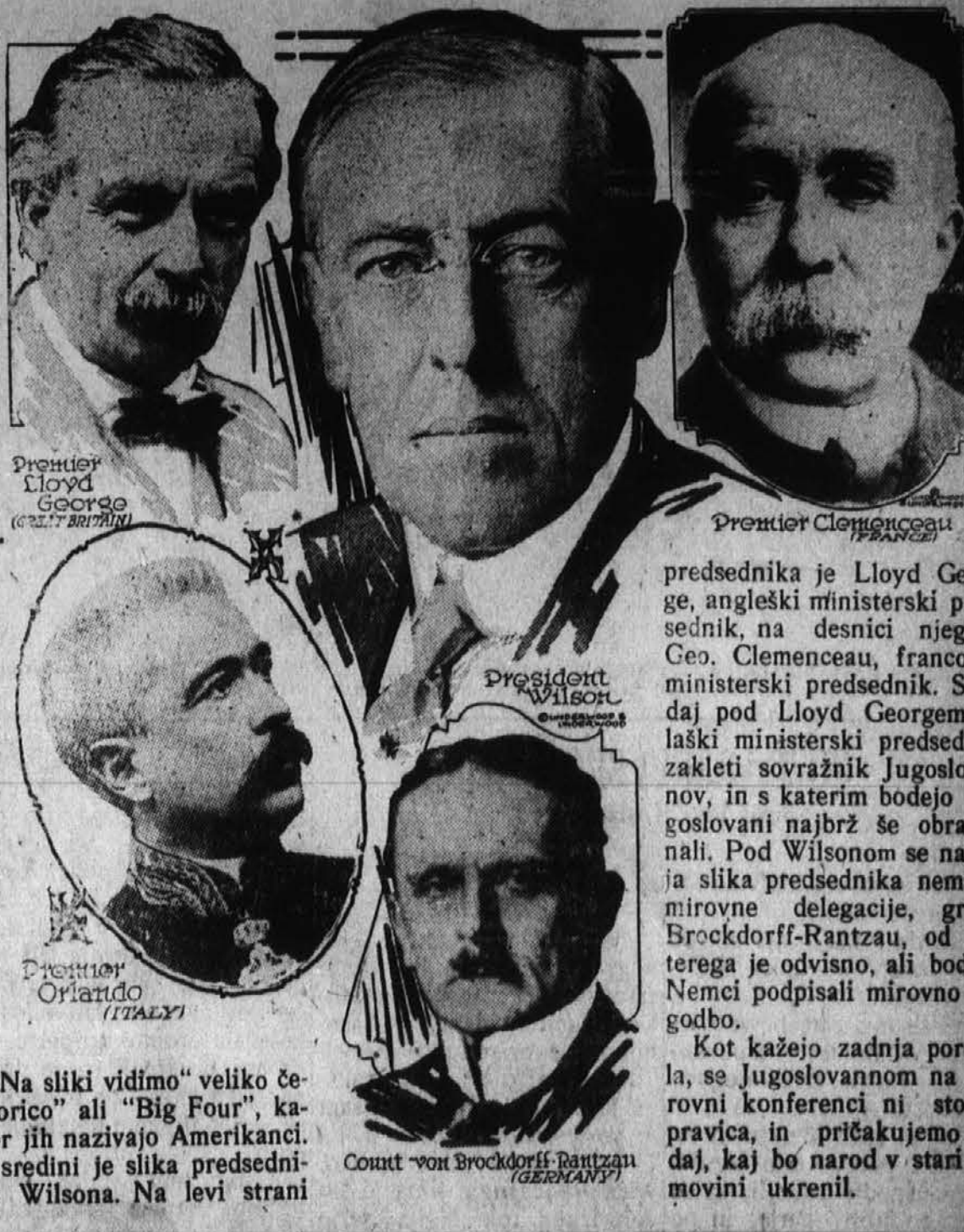
Na sliki vidimo "veliko četvoric" ali "Big Four", kakor jih nazivajo Amerikanci. V sredini je slika predsednika Wilsona. Na levi strani

Ministerski predsednik Francije, M. Clemenceau je večeraj nagovoril nemške mirovne delegate sledeče: Nobenega ustmenega izgovora ali protesta ne bodejo vpoštevali zavezniki. Če se imate kaj pritožiti, storite to pisмено. Toda podpisati morate v petnajstih dnevih.