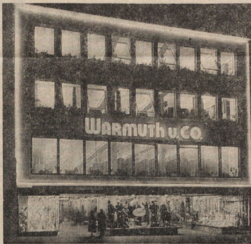
Das Stammkaufhaus am Hauptplatz Nr. 22

Tako deluje trgovska hiša DIETMAR WARMUTH & CO. na zgodovinskih tleh, ki so bila vedno središče trgovine, v svojem prvobitnem pomenu tudi sedaj.