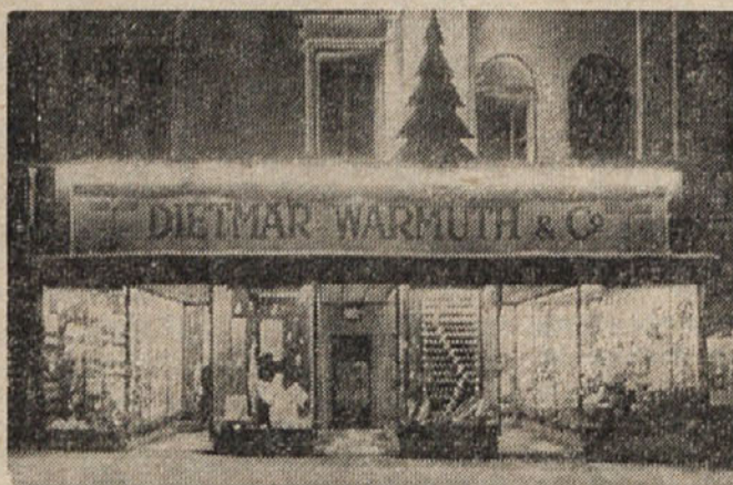
Portal um 1948