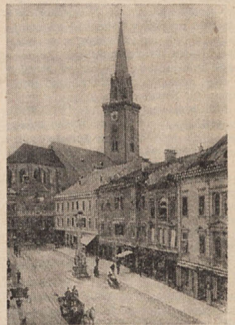
Hauptplatz um 1890

Zelo hitri dvig podjetja, ki se kaže v številnih blagovnih prometih kakor tudi v številu sotrudnikov (sedaj ob jubileju 550 oseb), daje tvrdki pečat ene največjih veleblagovnic Avstrije. Številne pogodbenice delavnice in zasebniki doma so vezani skozi celo leto za delo za tvrdko in so tako sebi in svojem postavljeni eksistenco. Blizu 1500 oseb živi od podjetja, ki je z zasebno iniciativo zrastle do take ve-