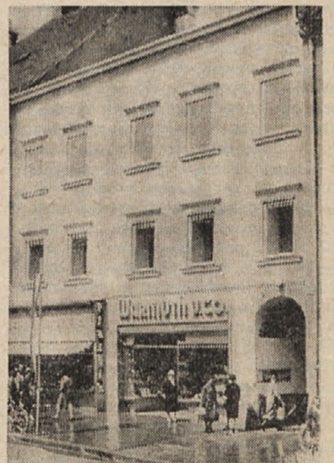
Zweites Kaufhaus am Hauptplatz Nr. 14