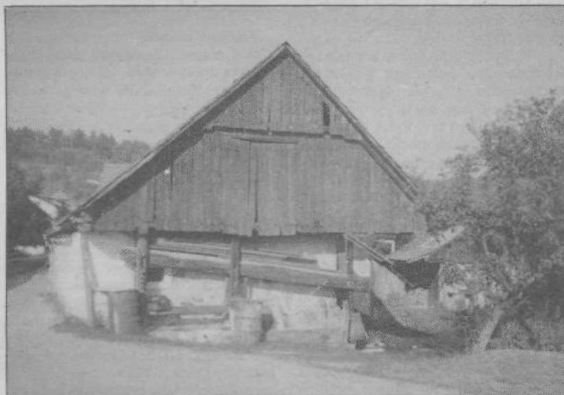
Stiskalnica za sadje, kakršne redko kje še uporabljajo za prežganje sladkega mošta

M Mercator Poslovni sistem Mercator, d.d. Ljubljana