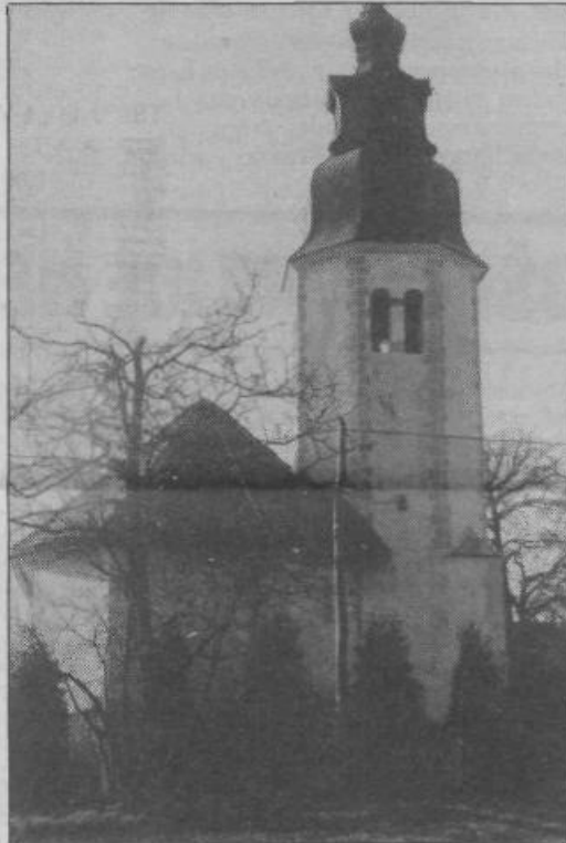
Fotografija in besedilo SLAVKO GERLICA

Že v letu 1987 je bila izdana odločba o začasni razglasitvi podružnične cerkve Povišanja sv. Križa v Velikem Trebeljevem za kulturni in zgodovinski spomenik. Konec leta 1991 pa so vsi trije zbori občinske skupščine sprejeli odlok o razglasitvi te cerkve za kulturni in zgodovinski spomenik. To so storili zaradi izjemnih kulturnih, zgodovinskih, znanstvenih, estetskih in krajinskih vrednot. Cerkev je bila grajena v več fazah in je nastala iz kapele. Posebno je poudarjen prizidan zvonik trdnjavskega videza. Kraj Veliko Trebeljevo se omenja že v 12. stoletju v starih listinah kot pridobljeno posestvo. Cerkev so začeli lani obnavljati, da bo zaustavljeno propadanje, kot velevali sprejeti odlok.