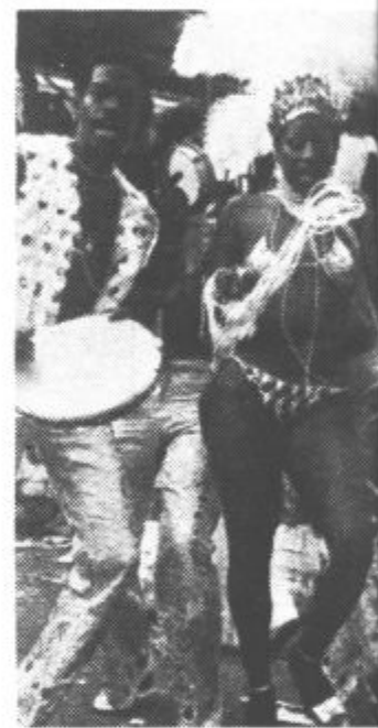
Domačini – vztrajni plesalci sambe.

Karneval se začne s posebej za to pripravljeno predstavo največjem hotelu Južne Amerike.