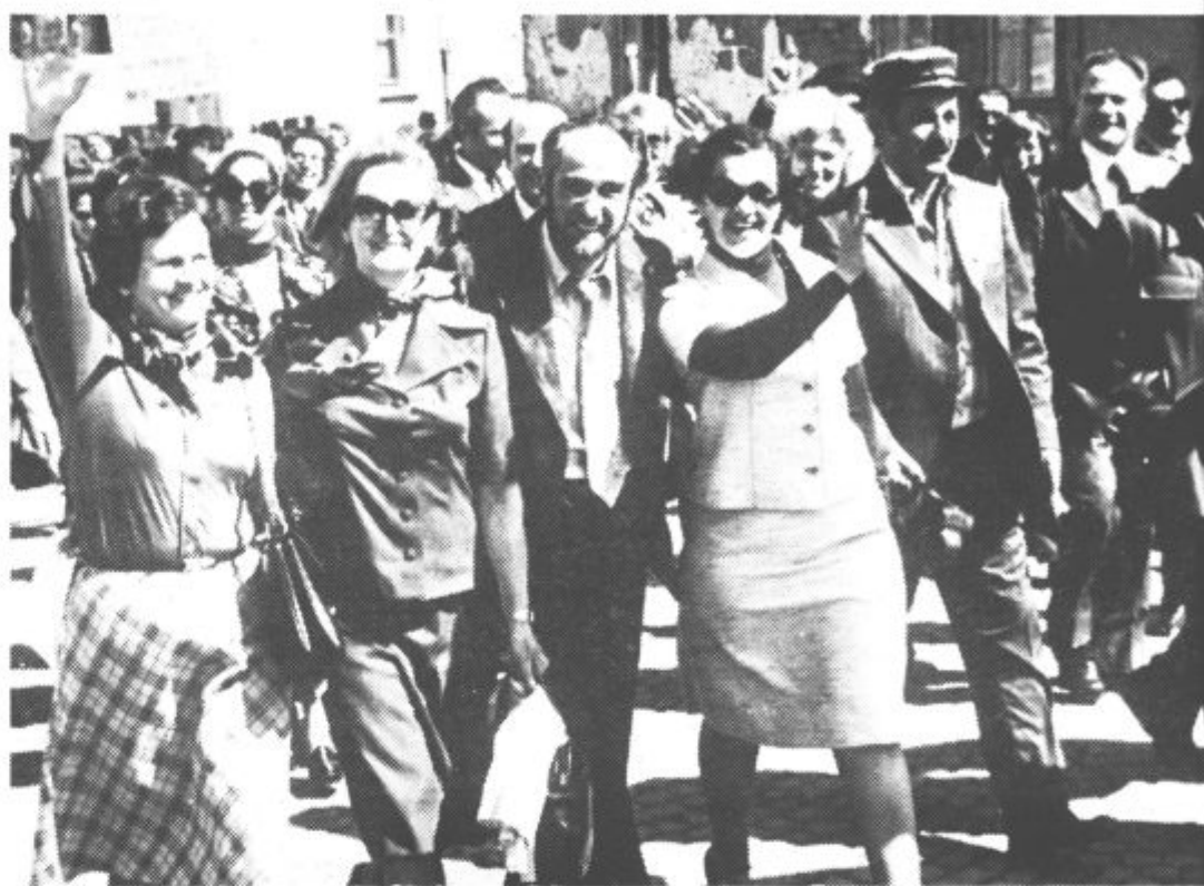
Z roko v roki, veselih obrazov, s pesmijo Slovenci kremeniti... so korakali brigadirji veterani po ulicah Brčkega. Na sliki: veterani iz Slovenj Gradca

Kaj ste občutili, ko ste se po treh desetletjih ponovno vrnili