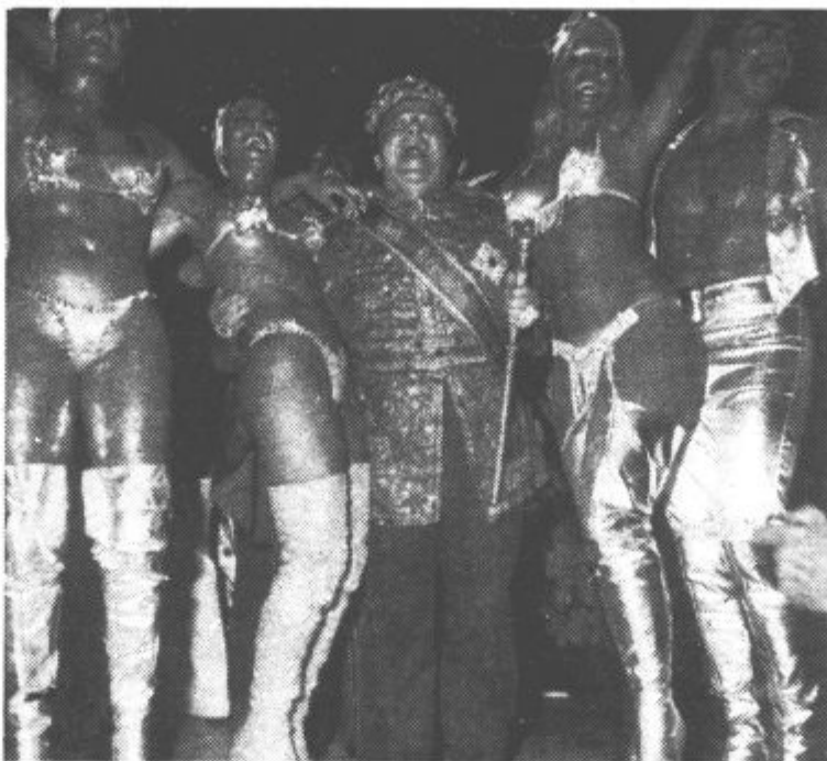
Med gosti karnevala prevladuje vedno bolj golota.

Nemci so napadali tudi z lažno propagando in različnimi triki. Metali so strašilne in piskajoče bombe, otroške igrače, nalivna peresa in vžgalnice. Skupina študentov je nekega dne videla, kako se je nad Vrati Narve razpočila ogromna pisana žoga, iz nje pa so se razsuli nekakšni letaki. Fantje so našli na tleh sovjetske bankovce in živilske karte, ki so jih zbrali in oddali oblastem. Ljudje so poznali sovražnikove trike in so jim le redko nasledli.