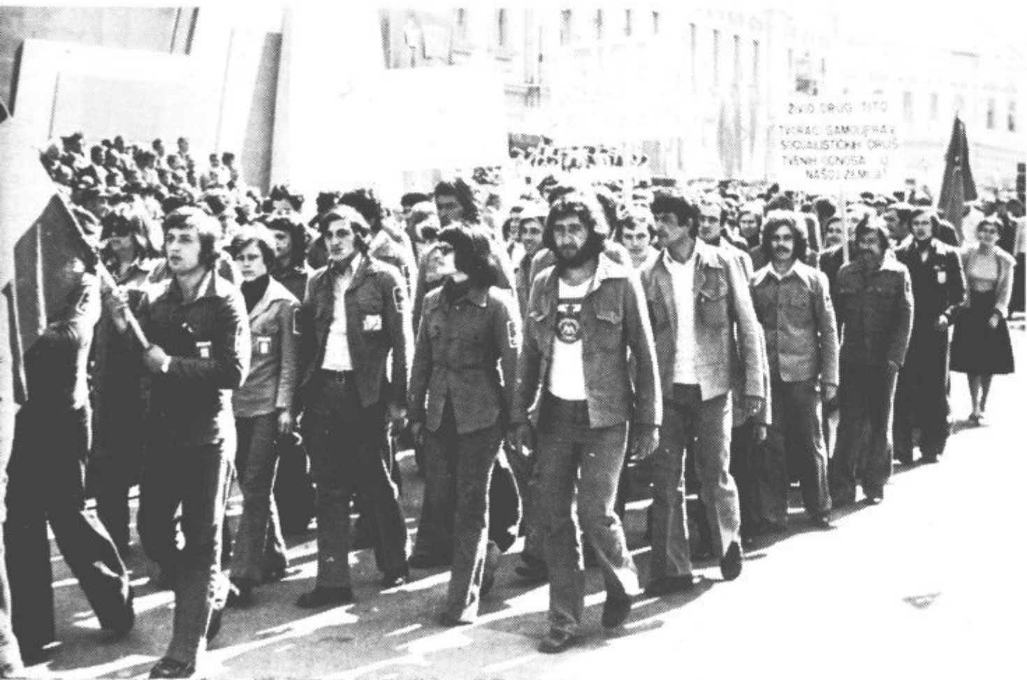
Brigadirji brigade „Bratstvo in enotnost“ elektro in elektronske industrije Jugoslavije, katere organizator je lani bila tovarniška konferenca ZSMS TGO Gorenje Velenje. Bili so med dvanajstimi brigadami, ki so v Brčkem prejele plaketo Veljka Vlahovića.