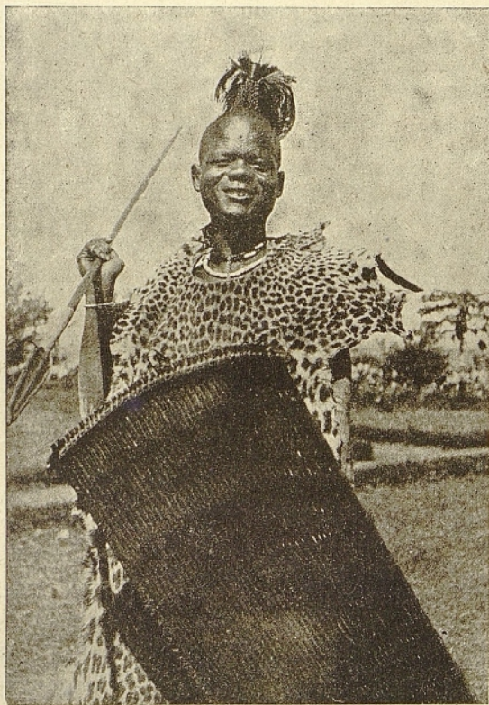
Schillukrieger mit Schild, Lanze und Leopardenfell.

ihre elf und ich kannte sie alle von früher. Unbeschreiblich war ihre Freude über unser plötzliches Erscheinen. Als wir ihnen erklärten, daß unser Besuch nur von kurzer Dauer sein könne, waren sie betrübt. Ich versprach ihnen, alles Mögliche zu tun, um von der Regierung die Erlaubnis der Rückkehr der Missionäre zu erwirken. Da sie aber in den letzten vier Jahren wiederholt einen Missionär kommen und gehen gesehen hatten, zweifelten sie an einer endgültigen Wiederbesetzung der Mission. Angelegentlich erkundigten sie sich um Aufenthalt und Befinden der Missionäre,