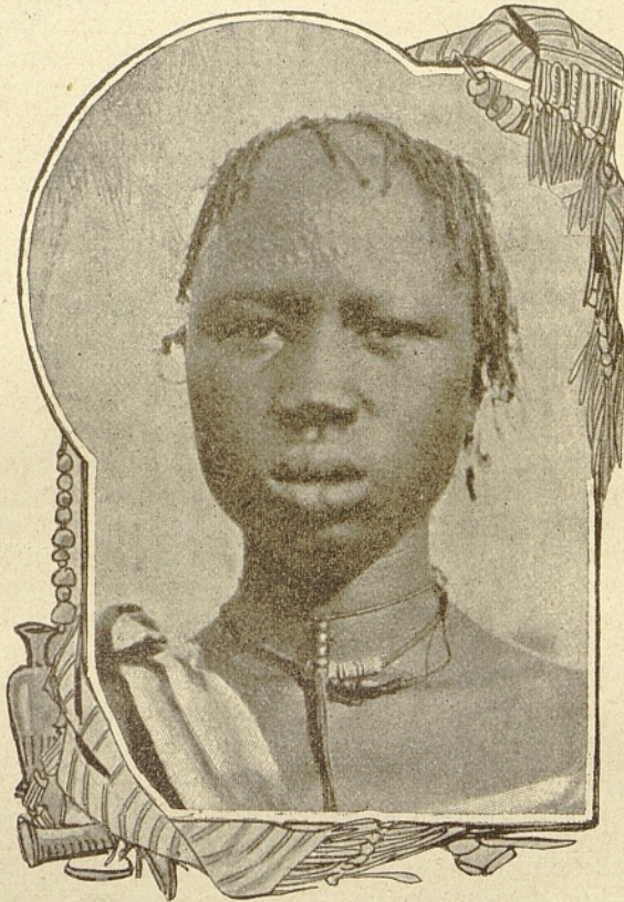
Schillukmädchen mit flacher Stirntätowierung.

Der folgende Tag, 18. Jänner, war Sonntag. Es fand eine Pontifikalmesse statt, während welcher die schwarzen Christen gemein-