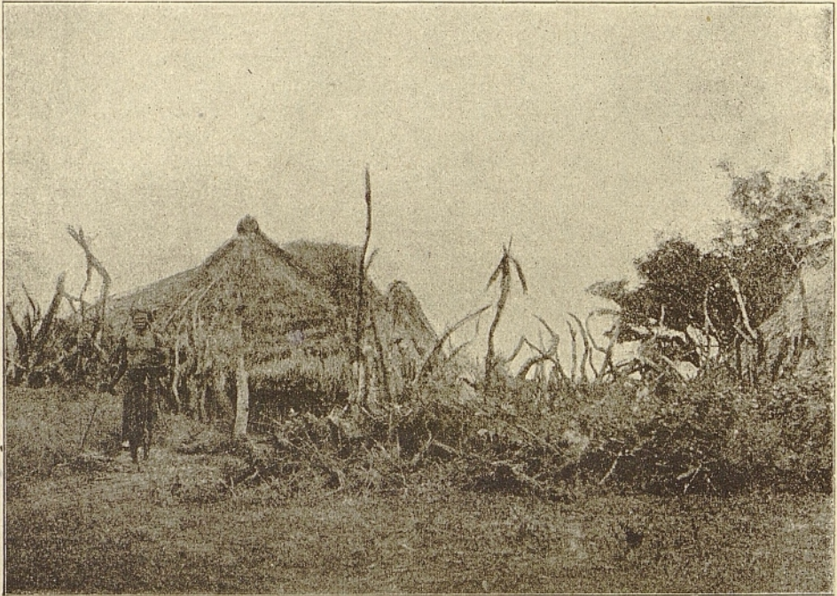
Negerdorf in Uganda.

Kizito zählte kaum 13 Jahre und stammte aus einer der vornehmsten Familien des Landes. Seine kindliche Unschuld, verbunden