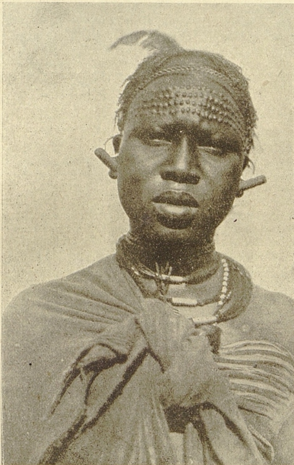
Schillukmädchen mit erhabener Stirntätowierung.

Taddeo Fatinelli aber saß in seiner Schreibstube allein. Er saß an dem großen Tische, wo er sonst über seinen Handelsbüchern brütete. Jetzt aber kümmerten ihn keine Handelsbücher. Er hielt den Kopf vornüber gebeugt und das Gesicht in den Händen vergraben, und wer dabei gewesen wäre, der hätte gesehen, daß der harte, nüchterne Kaufherr Träne um Träne weinte, als gelte es, den alten Menschen herauszuweinen