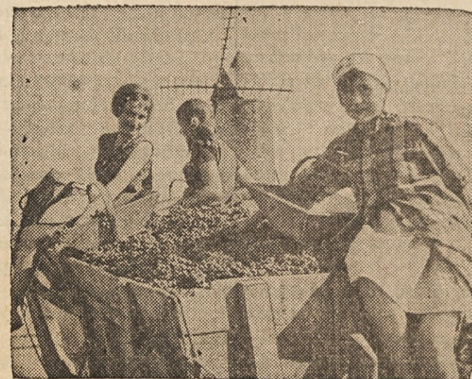
ODLIČEN LETNIK — V okolici Bordeauxa na južnem Francoskem je grozdje letos krasno dozorelo in dalo odlično kapljico. Pravijo, da take že niso pridelali leta in leta. Na sliki vidimo dekleta, ko se peljejo s polnim vozom grozda s trgatve.

1702 Lake Shore Blvd. KEnmore 1-6306 1453 East 62nd Street HEnderson 1-2088 Grdina trgovina s pohištvo — 15301 Waterloo Road KEnmore 1-1235 GRDINA — Funeral Directors — Furniture Dealers