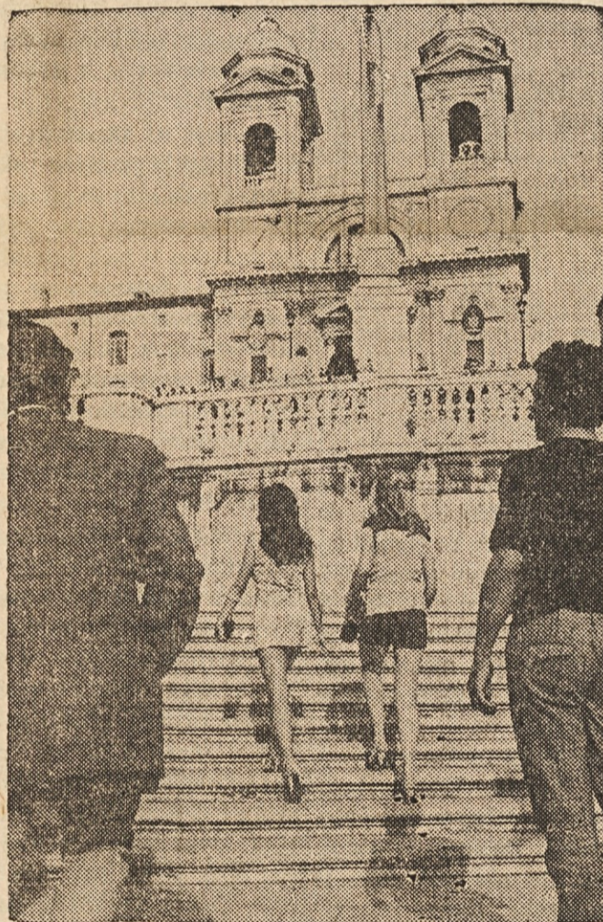
DVA SVETOVA — Slavna cerkev Trinita dei Monti v Rimu je spomenik vere in starega umetnostnega izročila Večnega mesta, dekleti, ki se vzpenjajo po "Španskih stopnicah", pa sta predstavnici novega rodu in nove mode.