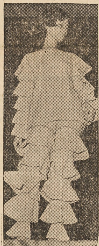
ZA DOMA! — Rudi Gernreich, stvaritelj ženske kopalne obleke "brez gornjega dela", je ustvaril tudi kroj ženske obleke za dom, ki ga vidimo na gornji sliki.

"O, milost, milost, nikoli več nikoli več, samo izpusti me," je prosil vrag, ki bi bil rad obljubil vse, samo da bi bil rešen iz groznih kovačevih rok. (Dalje prihodnjič)