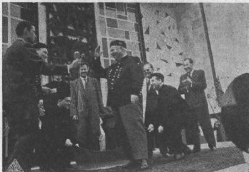
Tudi tovariš Hruščov se je podredil tradicionalnemu običaju in z nasmejanim obrazom »skočil čez kožo«.