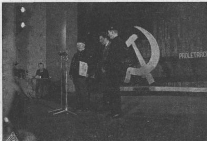
Potem ko je sprejel diplomu častnega člana RLV, se je tovariš Hruščov — oblečen v uniformo naših rudarjev — s toplimi besedami zahvalil kolektivu rudnika.