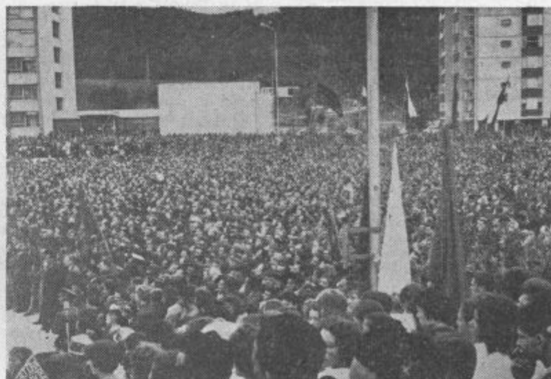
Na Titovem trgu pred kulturnim domom se je zbrala množica, kot jo doslej Velenje še ni videlo, da bi poslušala govore maršala Tita in tovariša Hruščova.