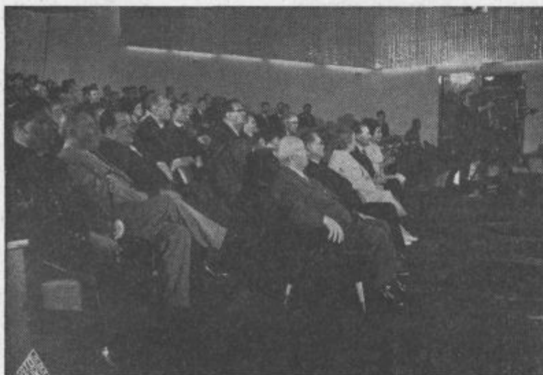
Program, ki ga je v sodelovanju z DPD Svobodo Velenje pripravil Centralni delavski svet rudnika na svečanem zasedanju, so spremljali visoki gostje z zanimanjem in pozornostjo.