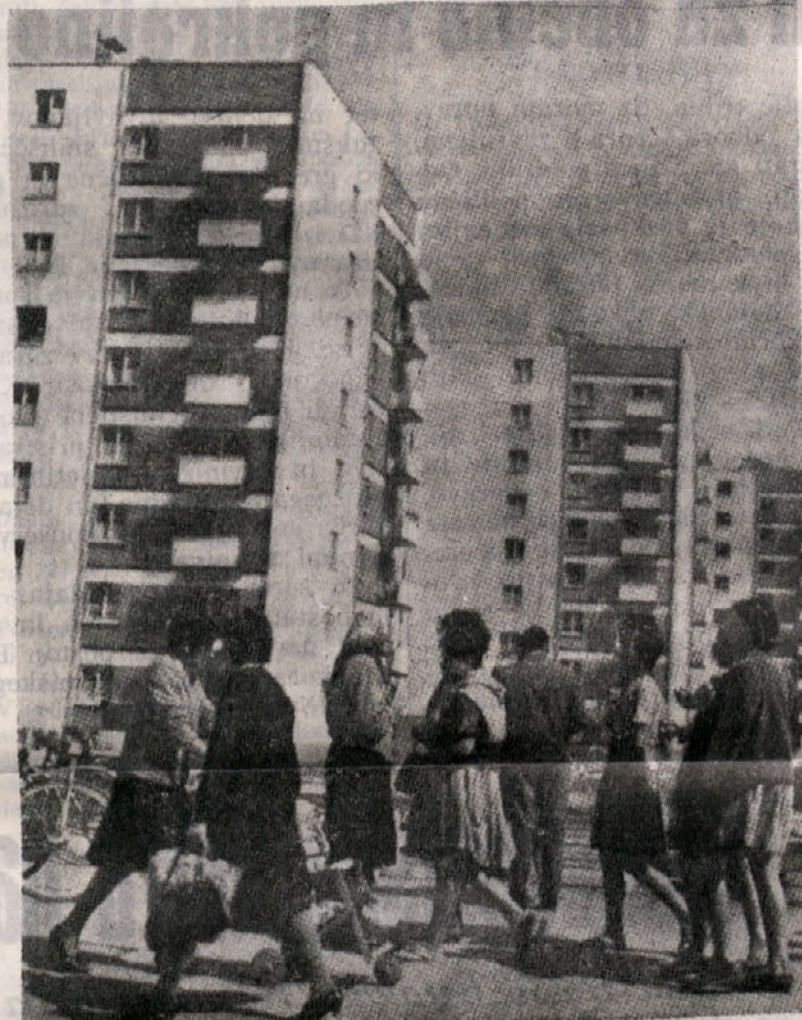
Zivljenje v Sloveniji se je po vojni bistveno spremenilo in očitno govori o napredku na vseh področjih gospodarstva, o povečani potrošnji dobrin, o zboljšanih pogojih šolanja, o dostojnejših stanovanjih, o razvoju prometa, skratka o zvišanem življenjskem standardu v primeri z razmerami pred vojno. Številno zaposlenih je trikrat večje kot leta 1939, socialno zavarovanih je skoraj 50% prebivalcev, zdravstveno pa so zavarovani skoraj vsi prebivalci. Na gornji sliki: pogled na novi del mesta Kočevje.

fronta izšla iz zmagovite oborožene revolucije okrepljena ter z jasno zavestjo in usmerjenostjo množic v obnovo do temeljev uničenega gospodarstva in v pospešeno graditev nove socialistične družbe.