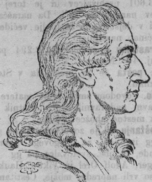
Anton Fürst v. Kaunitz-Riefberg

2. svečana je 200 let, odkar se je porodil V. A. knez Kaunitz-Riefberg, ki je bil pozneje desna roka ce-