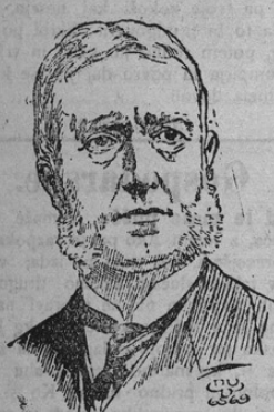
Graf Franz Thun-Hohenstein

Cesar je imenoval grofa Franca Thun za namestnika na Češkem. Thun je vkljub svojemu nemškemu