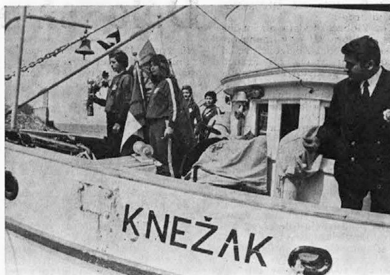
Štafeto je v Koper prinesla naša ladja Knežak

Kar se tiče prostega časa, ugotavljam, da ga imam vedno manj. Trenutno obiskujem večerno politično šolo, tako da imam pro-