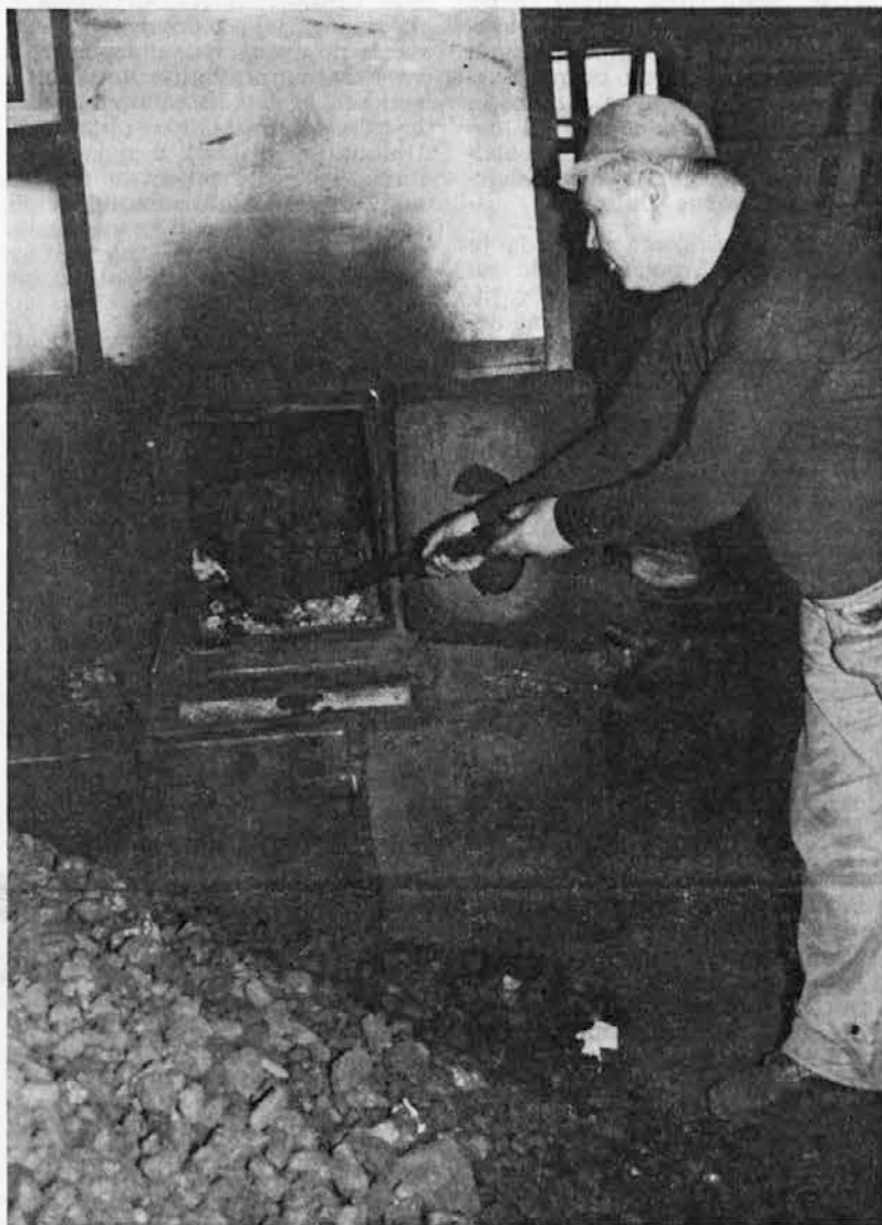
Delo v kurilnici