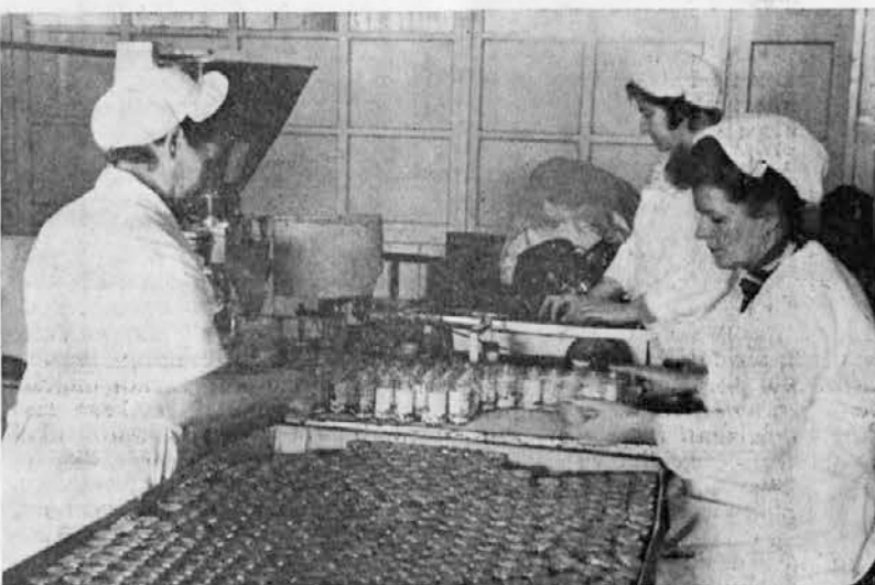
Oddelek juh — polnjenje začinke v kozarce

noma neenakopraven položaj. Druga podjetja naše panoge, ki so dobila te ugodne kredite, so si z njimi zgradile hladilniške kapacitete (za ulov in distribucijo ribe) in modernizirale ulov, medtem pa je Delamaris imel izredno težave z enostavno reprodukcijo ob nizkih osebnih dohodkih.