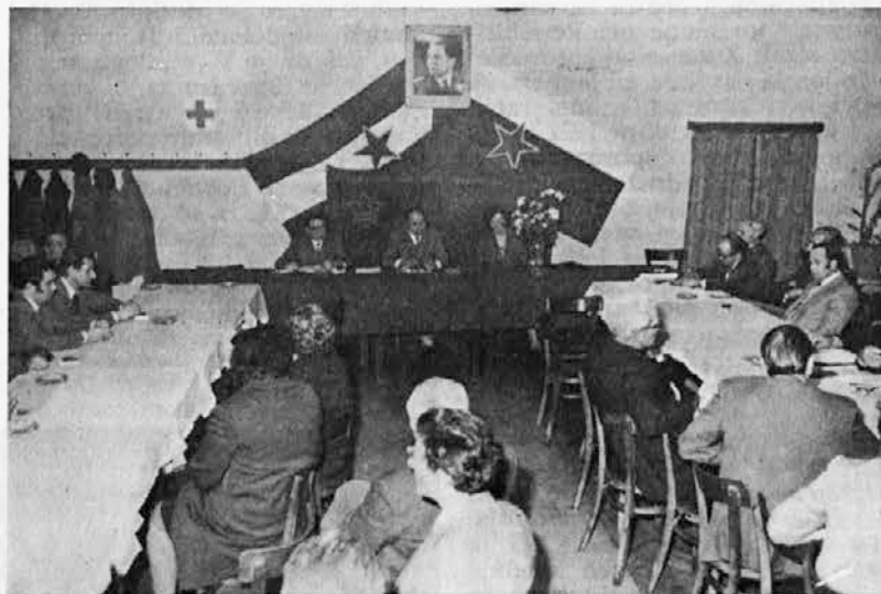
Predsedstvo konference, katero je vodil Savo Kapelj

je, enotnosti naših narodov, in delavskega samoupravljanja, je bila velika. Na koncu poročila je bilo še poudarjeno, da je naša vsakodnevna dolžnost preprečevanje rasnih sovražnih parol, ki prihajajo z zahoda in vzhoda. Po prebranem poročilu se je razvila živahna razprava. Prevladovala