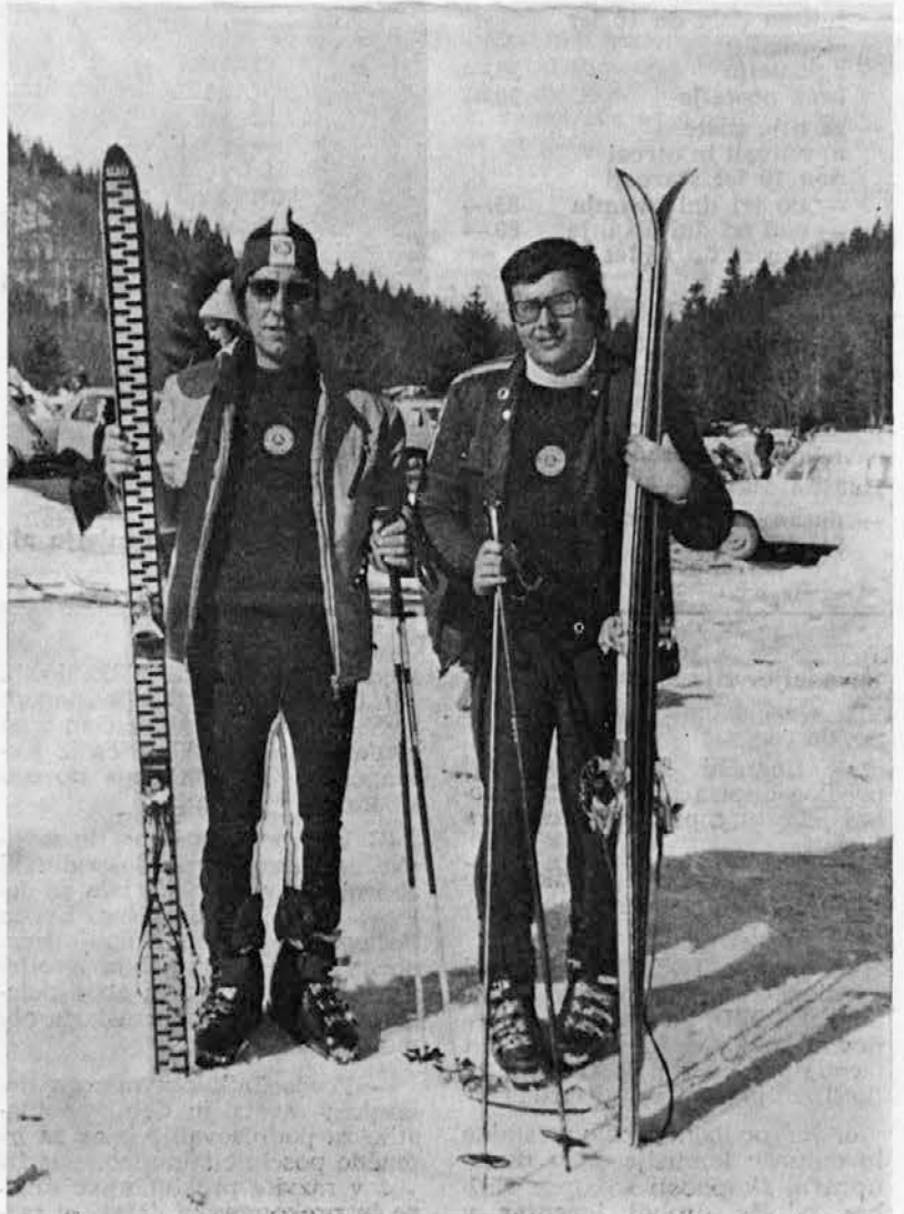
Naša dva tekmovalca, ki sta zastopala barve Delamarisa