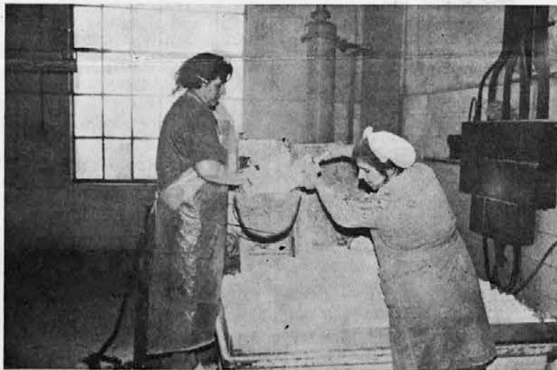
Oddelek juh, delo pri mletju ni lepo

Predsedstvo skupščine SR Slovenije Izvršni odbor republiške konference SZDL Izvršni odbor predsedstva republiškega sveta ZS SRS