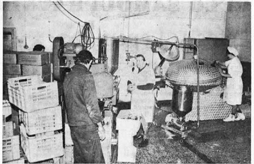
Oddelek paštete, izdelava in polnjenje 100 g kokošje paštete