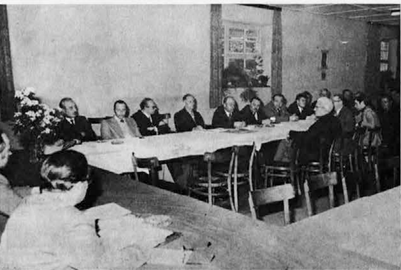
Udeležba borcev ni bila velika

10. aprila 1975 se je sestal cen-tralni delavski svet in na podlagi predloženega gradiva s strani strokovnih služb sprejel več skle-pov.