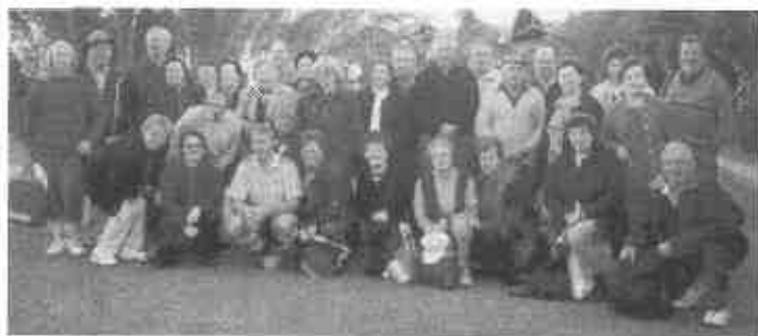
Del skupine izletnikov v Alice Springs.