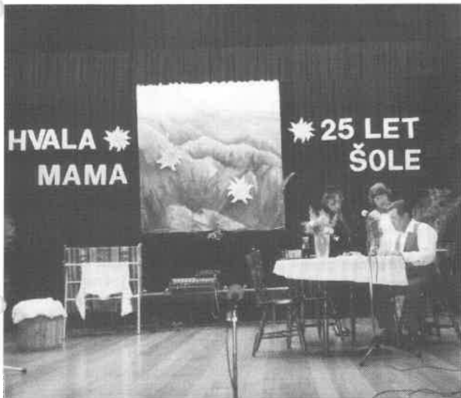
Enodejanka "čeber" -nastopajo:M.Lapuh,A.Toplak in A.Klančič