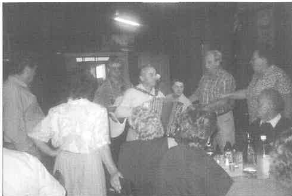
NAŠI STARI PRIJATELJI IZ KLUBA-ALBURY-WODONGA "SNEŽNIK"