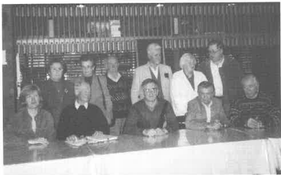
ODBORNIKI S.D.PLANICA ZA LETO 1999/2000