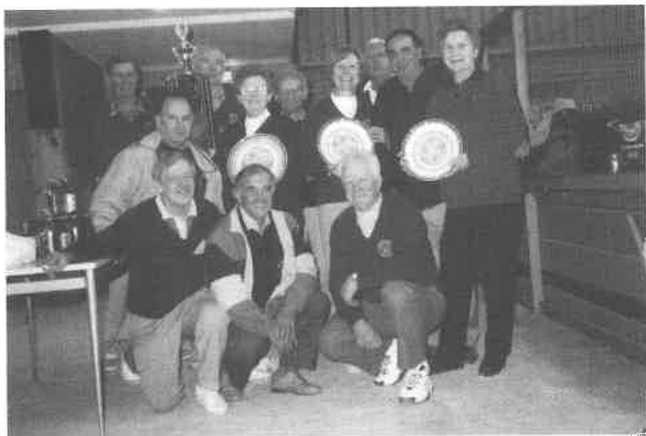
BALINARJI S.D.PLANICA IN ITALO KLUBA ZMAGOVALCI - PLANIČARJI