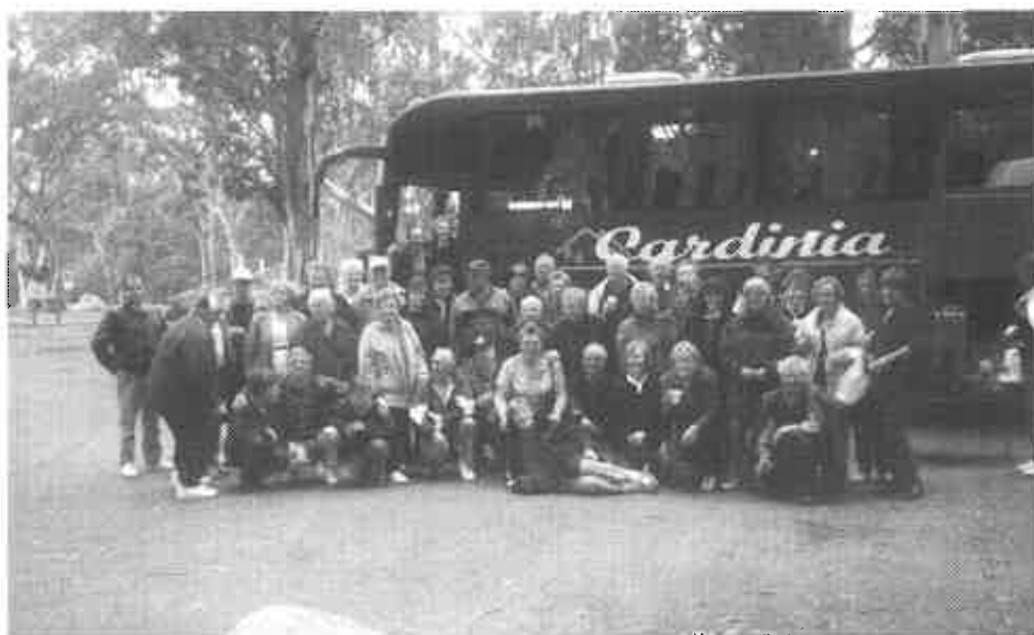
SKUPINA IZLETNIKOV - PLANIČARJEV - BRIGHT, MT. BUFALLO