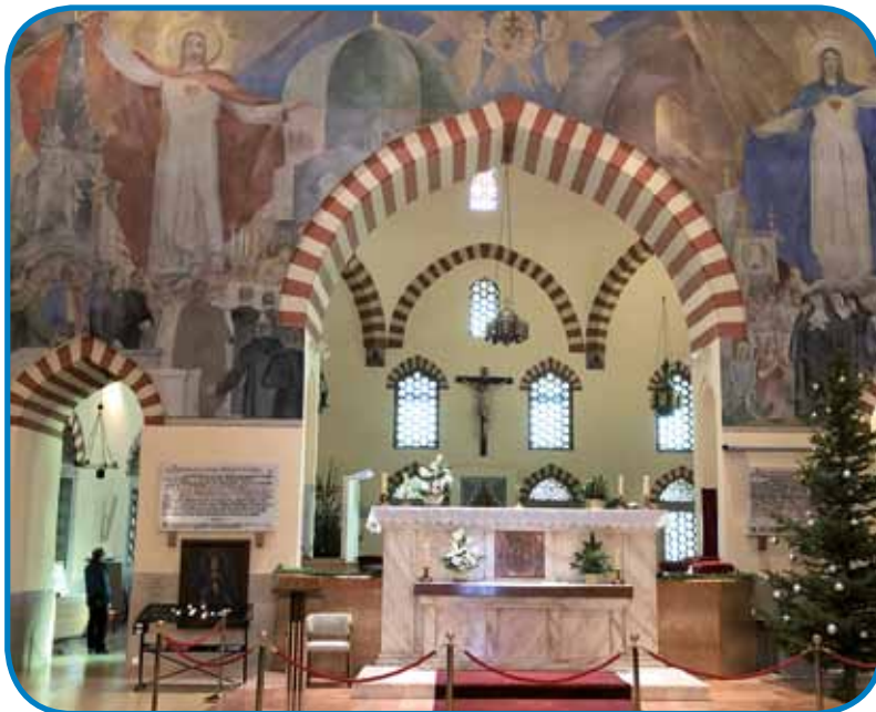
Forme z Vzhoda, düša z Zahoda - džamija v Pécsi je nekda bila ino je gnes tö katoličanjska cerkev

malom posvejti svoj laptop fejst klačo eden moški srednji lejt. Nika je nej mرنjavo zavolo nepričaküvani gostov, zatok sva müva s padašom