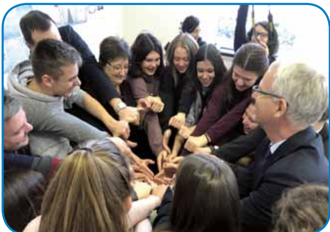
»Vsi verujemo v medsebojno ljubezen« - je bilo gesto na Škofijski klasični gimnaziji v Ljubljani

Prav zaradi tega je madžarski državni sekretar zaprosil predstavnike Urada, naj zastopajo interese Slovencev na Madžarskem pri Vladi Republike Slovenije, podobno kakor zastopa madžarska politika interese prekmurske madžarske skupnosti. To pa tudi preko finančne pomoči, Slovenija naj torej poskrbi za podobno vsoto podpore, kot jo dobivajo Madžari v Prekmurju.