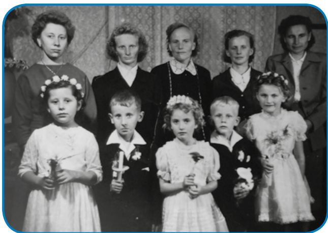
Kejp po prvaj spauvedji

»Dja sem v židanoj fabriki delala, gda so go pa zaprli, te sem najprvin na placa delala, sledkar pa v Vosseni. Mauž pa sprvoga v KTSZ-a (zadrugi), sledkar pa je