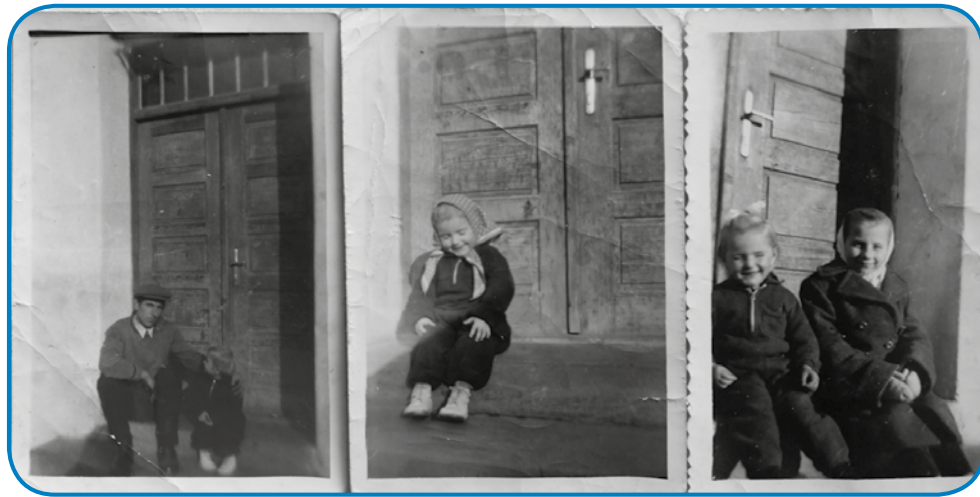
Trgé kejpji na stumbaj pri Babinom rami

bijo, zato ka se je leta 1922 narau-do, mati je mlajša, ona je 1931. leta rojena. Stariške so zato zidali najbola, ka je v starom