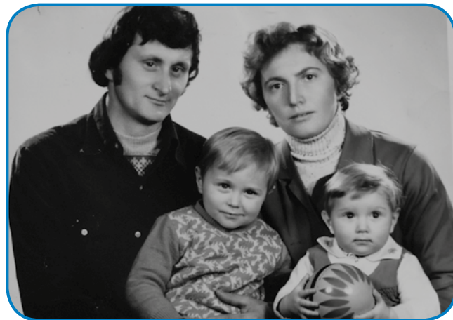
Z možaum pa dvöma detetoma

»Brž so ga gorazozidali, oča so v ciglenci delali, pa zavolo tauga je cigeu pa črpnje bola fal dau-bo, drügo pa tau, ka je lústvo te še sploj pomagalo eden drügo-