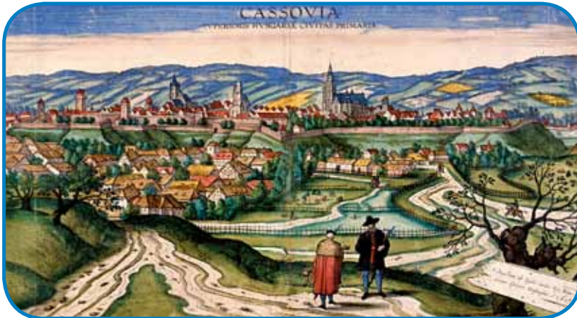
Kassa (Košice) je gratala v törski cajtaj prvi varaš na Sövernem Vogrskom

Na Erdeljskom so cveli saški varaši. Če rejsan so se tradicionalne poti prauti Zahodnoj Evropi vtrgnile, so leko nemški pozlatari tam eške itak odali svoje produkte, doma pa meli küpce za gvant ino leder. Cejlo mauč v tej mejstaj je tö edna mala elita v