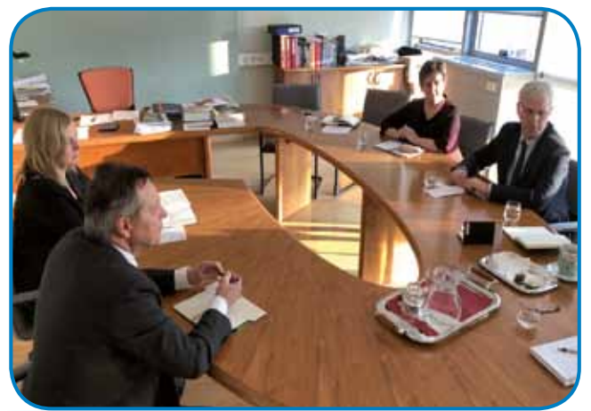
Na Zavodu za varstvo kulturne dediščine Slovenije so obravnavali tudi obnovo cerkva v Prekmurju in Porabju