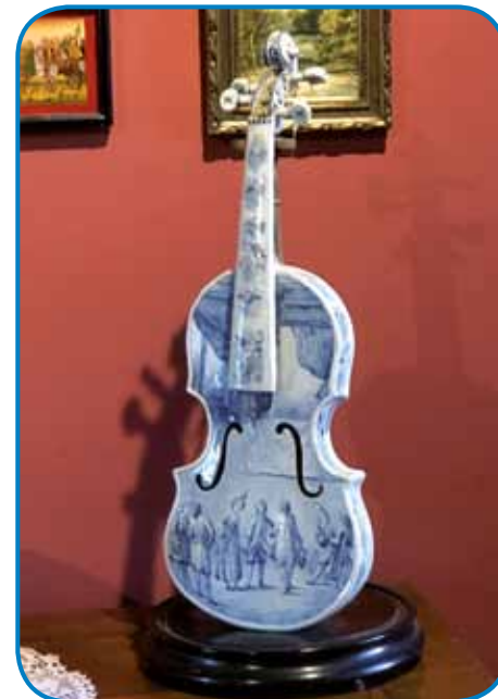
Edne porcelanaste gosli z erične manufakture Zsolnay

Zvün naja se je eške en par korejskim turistom prišikalo nutprišvercati, v cerkvi sta kralüvali kmica ino tüüča. Nej daleč od oltara je pri ednom