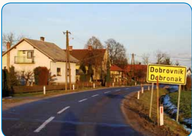
TRNOK RAD ČÜJE PORABSKI GUČ stran 45