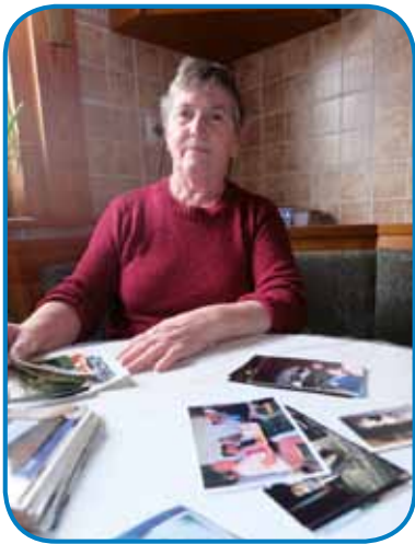
Babiba Eržika rada pripovejda

»Zato, ka so moji stariške tó tjpili eden stari ram, pa tau-