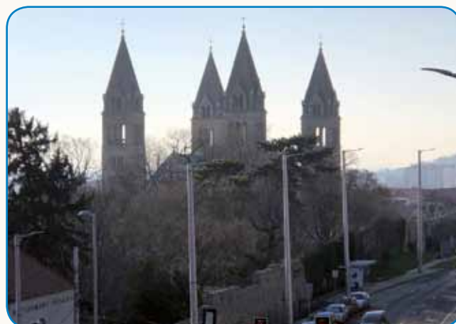
CERKEV, MUZEJ, MUZEJ, CERKEV stran 9