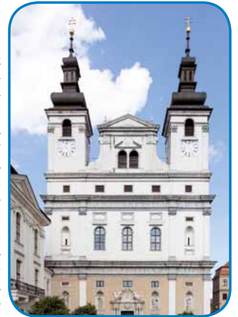
Prvo (rano)baročno vogrsko cerkev so v Nagyszombati (Trnavi) posvetili leta 1637 - Péter Pázmány je tau več nej doživó

V dugi bojnaj sta gratali dvej nauvi skupini, šterivi sta bili nindrik zmejs med pavri ino nemešnjaki. Če rejsan je 20 gezero »vitezov« na gradaj nej mejlo tituluša, jim je porce nej trbölo plačüvati. Za svoje sodačke vrline pa so leko brž naprej staučili ino eške grünte so jim tö talali. Ništerni od té sodakov so - vküper s kravdjimi pastérami - gratali »hajduki« Istvána Bocskaina, šteri je 10 gezero svo-