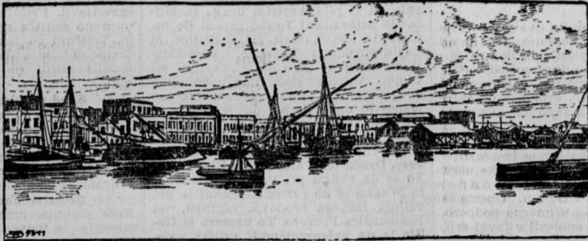
Luka v Prevezi.

odkar se je ustanovila; že ve, zakaj. Sicer pa pustite Marijino družbo in Orle pri miru; vam niso prav nič mar! Že v drugo se zaletuje v župnikovo biro in nagovarja kmete, naj župniku vrata zapirajo. In uspeh, gospod dopisnik! Nikoli ni bil župnik tako prijazen sprejet od ljudi, kakor letos, in je več dobil, kakor druga leta. Pri otepih, kateri so dopisniku posebno v želodcu, bo menda tudi tako, vsaj domača vas, katera je dozdaj dala, ta se je skazala. Torej, gospod dopisnik, le še huiškajte zoper tega preklicanega župnika — njemu v korist. Tak dopis v »Jutru« je narekovalo zagrizeno sovraštvo, grda nevoščljivost in škodoželjnost. Zares, lepe lastnosti za človeka, kateri se hoče prištevati olikanim. — Še nekaj! Pošteni občani se čudom čudijo, kako je mogoče, da so se nekateri oklenili takih ljudi in da se še sedaj tega ne sramujejo.