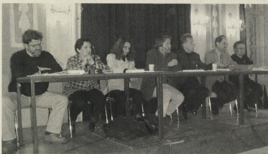
O Slovencih na Štajerskem so diskutirali predstavniki strank

Na vsak način je med ljudstvom še ogromno nerazčiščjenih pojmov in vsaj tu je treba dati zastopniku ÖVP prav: treba se je pogovarjati, pogovarjati, odpravljati nevednost in z njo predsodke. Čeprav je bil mag. Pipp, ki je sedel med občinstvom, mnenja, da »pogovarjanje nič ne prinese« in da se vse le zavlačuje. Prav ima sicer, da bo ustavno sodišče marsikaj razjasnilo – ni pa prav, da se na to opozori kot s palico, zakon je za ljudi in ne proti njim, o tem pa jih je treba šele prepričati. S. W.