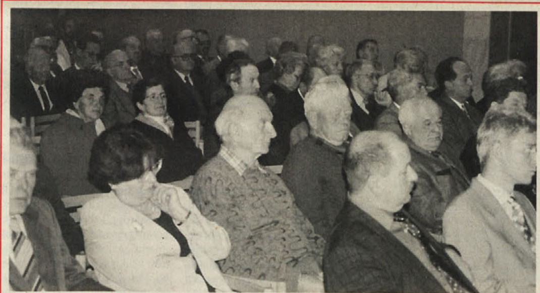
Z občnega zbora Zveze koroških partizanov, na katerem so izvolili novo predsedstvo

Predlog je bil posredovan ustavnemu odboru v parlamentu, kjer ga bodo obravnavali bolj detajlirano.