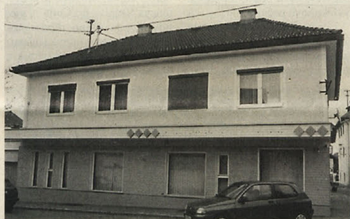
Stara posojilnica kot razstavni prostor

V petek, 25. aprila, ob 14. uri popoldne bo v Borovljah odprta deželna razstava »Vse je