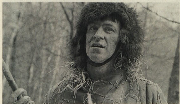
Utešeni Ötzi bo poletel bival med nami

Gremo Ötzija gledat! Kot posebna zanimivost bo v parku ob razstavnih stavbah živel »Ötzi«: nek arheolog iz Belgije bo vse poletje bival tam, vmes pa bo hodil v Čepo in na Žingarico, kamor bodo vozili avtobusi radovedneže gledat, kako so lovci pred 4000 leti kurili ogenj in izdelovali orodje in orožje. Tudi oblečen bo čisto originalno v plašč iz trave in usnjena oblačila!