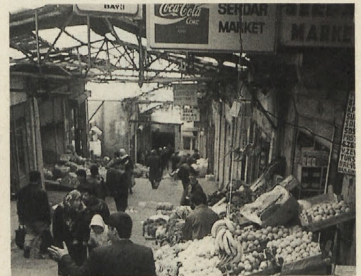
Tržnica, kjer je dobiti vse mogoče sadeže. Mesto Diyarbakir je znano po melonah, ki v premeru zrastejo tudi do metra in pol.