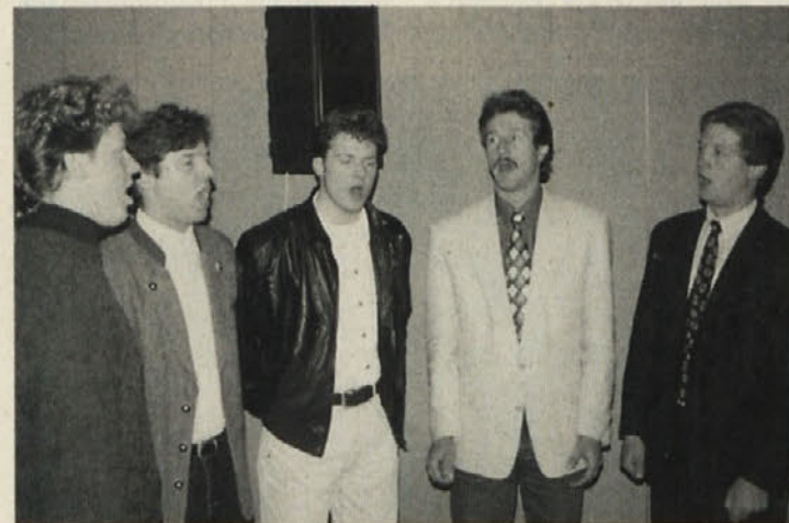
Občni zbor so s partizansko pesmijo pozdravili Bratje Smrtnik