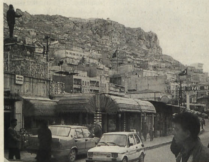
Mesto Mardin ob meji s Sirijo, kjer je oporišče NATO. Levo zgoraj je spomenik Kemala Atatürka.