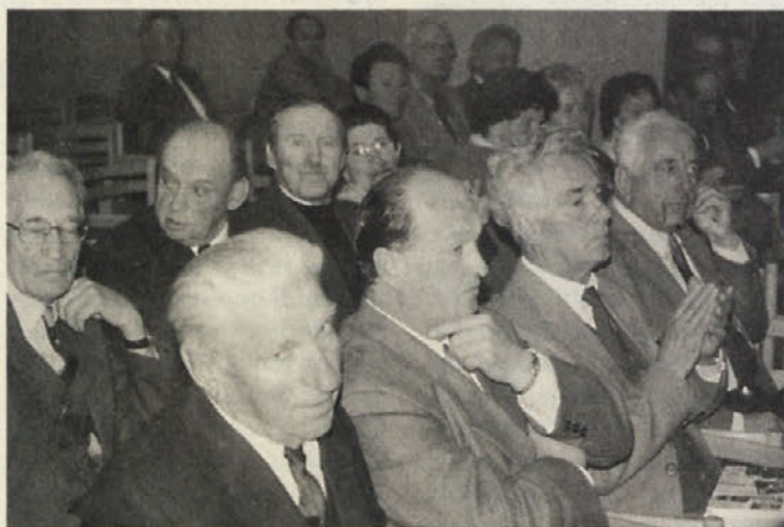
Borčevska in občinska delegacija iz Vojnika