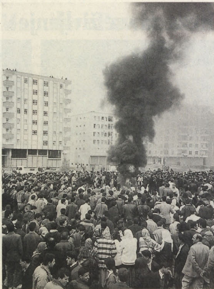
Ogenj v mestnem predelu Batikent. Tu se je popoldne zbralo nad 10.000 ljudi, ki so nato demonstrirali po mestu.