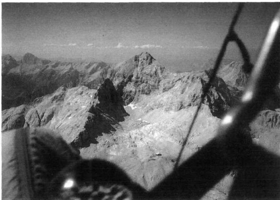
Poleg instrumentov za varno letenje ima jadralni padalec na rekordnih poletih vedno s seboj fotografski aparat, da lahko pozneje dokazuje, kje je letel