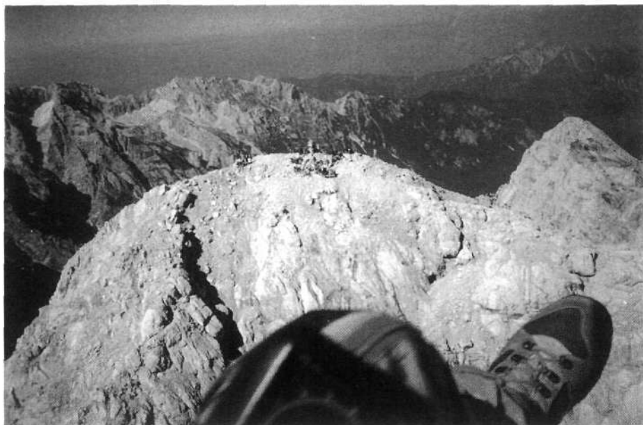
Z jadrlnim padalom nad Triglavom, na vrhu katerega mu ob Aljaževem stolpu mahajo planinci

tografiral je, odzdravljaj planincem, ki so bili tisti trenutek na najvišji točki svoje domovine, do katere se je mogoče povzpeli peš, pogled na ljudi, ki so stali ob Aljaževem stolpu in mu mahali, se je zil s čudovitim pogledom na Julijce, ki so ležali pod njim. Vendar v zraku ni bil sam: nepozaben pogled na očaka Triglava je delil s piloti jadrlnih letal, ki so enako kot on krožili nad tem delom Triglavskega narodnega parka.