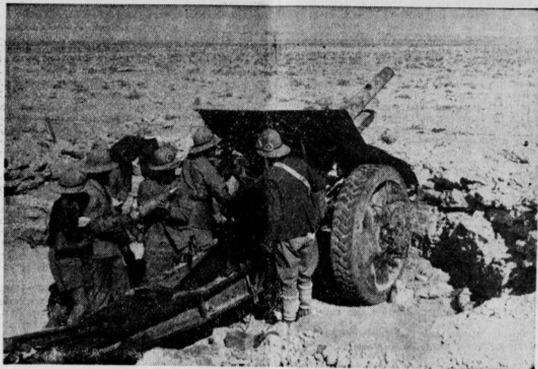
Italijansko topništvo srednjega kalibra obstreljuje sovražne postojanke pri Tobruku