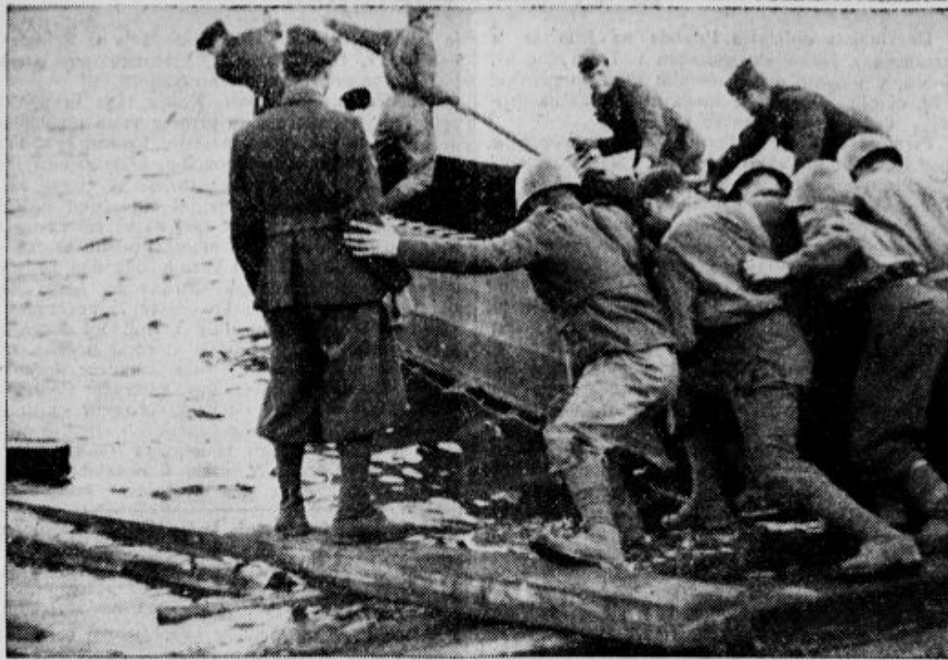
Ruska fronta: Italijanski ženijski oddelki med sovražnim ognjem delajo pontonski most čez Dnjeper