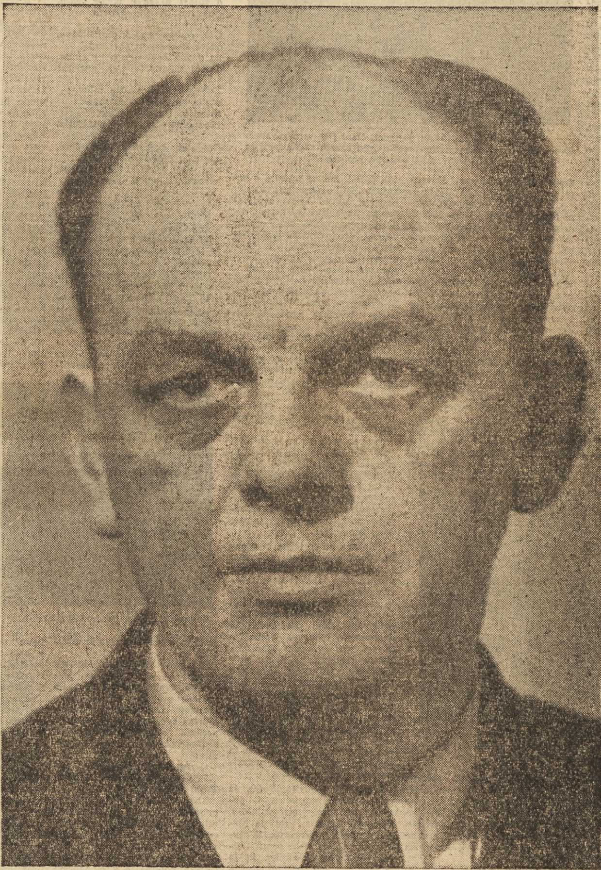
Tajnik lesnih delavcev.