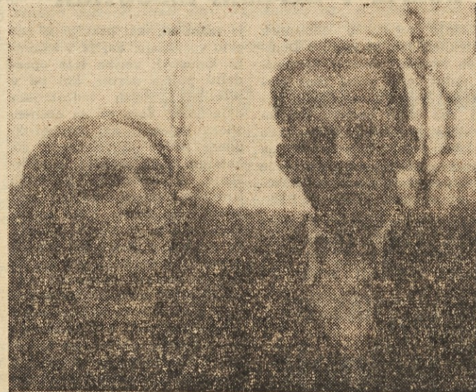
V vlogi Kantorja v Cankarjevi drami leta 1937

Zbrali smo se dva, trije in razpravljali. »Kje je Šimen? In že je bil med vrati. V roki dopis, kdo ve kaj je v njih. »Bo seja?« je vprašal. In je bila seja. Poročal je, predlagal, zapisoval. Razgovarjali smo se o kakem problemu, on pa: »Je že računalo... toliko ton, toliko di-