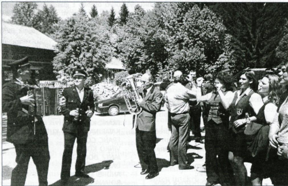
Veseli zaključek slovesnosti

V nedeljo, 13. maja, so gasilci gasilskega društva Ponikve v lepem sončnem vremenu pripravili sedaj že tradicionalno slovesnost v čast svojemu patronu in zaščitniku sv. Florijanu. V najlepšem mesecu maju goduje svetnik sv. Florijan, ki so ga gasilci zaradi njegovih lepih lastnosti po zgodovinskem izročilu vzeli za svojega zaščitnika in priprošnjaka. God sv. Florjana praznujejo gasilci v zahodni Evropi, pa tudi pri nas.