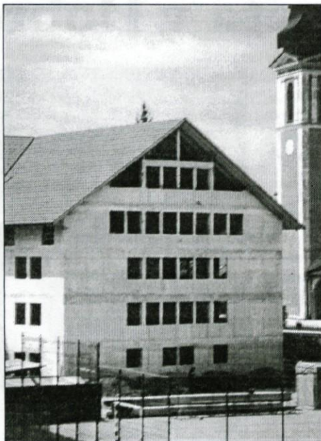
Jakličev dom - pogled z igrišča

bomo imeli razvaline na sredi Vidma. Če bi dom ostal v lasti župnije, bi ga morala prenavljati ali na novo graditi župnija, ki ga pa kot takega ne potrebuje. Obnova ali novogradnja pa bi predstavljala za župnijo velik zalogaj in bi se obnova zelo zavlekla, zato bi še dolgo stal na pol dograjen. Moram pa resnici na ljubo reči, da so bili nekateri prepričani, da naj bi dom ostal v lasti župnije, ne glede na vse posledice. Dokaj močne so bile tudi obratne želje nekaterih posameznikov, ki so mislili, in nekateri še danes mislijo, da se nam z župnijo ni potrebno dogovarjati, ampak se lahko kar naduto obnašamo, kot v polpretekli dobi, češ saj je vse naše. V obeh primerih bi dom še dolgo ne bil na novo zgrajen, saj bi se lahko prepiranje in tudi tožarjenje vleklo še leta in leta. No, prevladalo je spoznanje, da ohranimo dobro sodelovanje župnije in občine in da je najbolje, če župnija dom podari občini tudi uradno. Občina ga namreč ne bi mogla ne graditi ne obnavljati, če ne bi bil občinska last, župnija pa tudi ne bi mogla zbrati toliko sredstev. Pri tem moram poudariti, da imamo župnika, ki je situacijo zelo