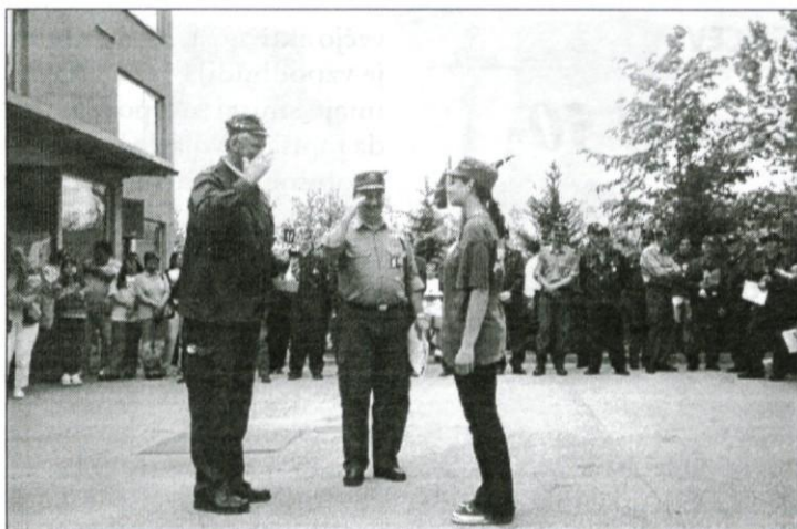
Vodstvo GZ Dobropolje predaja pokal desetarki

no. Rezultati so bili dokaj izenačeni, kar je kazalo na dobro pripravljenost vseh nastopajočih ekip. Kmalu po zaključku tekmovanja so bili razglašeni rezultati in podeljeni pokali za prva tri mesta.