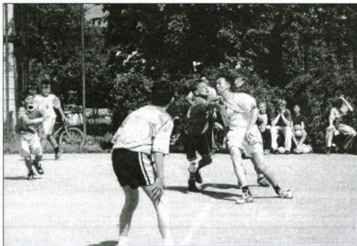
Zagrizeni boj mladih rokotemašev