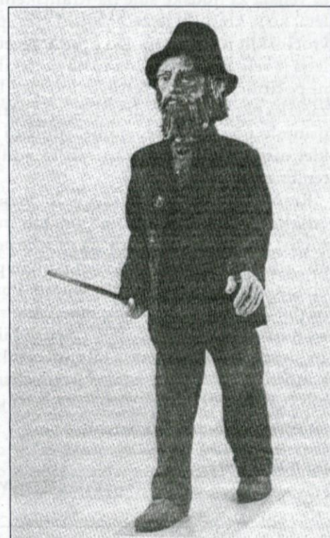
Učitelj vaške šole (po sliki Alberta Ankerja lutka na razstavi v Slovenskem šolskem muzeju.

* Sedaj se uveljavi osemletna šolska obveznost, vendar pa je zakon dopuščal odstopanja. Običajno je bila na Kranjskem šestrazredna osnovna šola, k njej pa je bila priključena še dveletna ponavljalna šola, katere učenci so imeli pouk ob četrtkih. Da je prišlo do šestrazredne šole, je trajalo dolgo časa, ponekod kar nekaj desetletij, zato lahko srečamo različne pojme v poročilih: trirazrednica, štirirazrednica... Ta beseda nam pove, koliko je imela določena šola razredov. Ob tem moramo poudariti, da je sedaj konec trivialnega šolstva, temveč se uveljavi ime osnovna šola. Na podeželju se le ta imenuje ljudska šola, ki je osemletna, v mestih pa so lahko učenci vstopali po končanem petem raz-