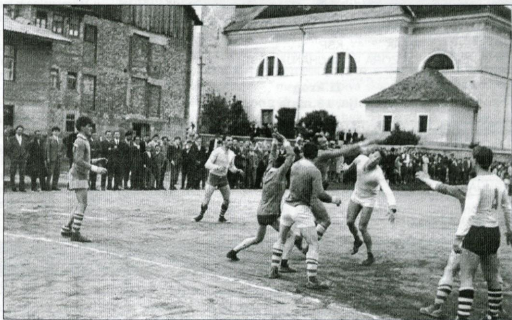
S tekme Dobrepolje - Kočevje v Dobrepolju