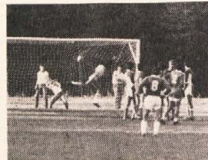
Velik je s prostim strelom zadel drugi odločilni gol