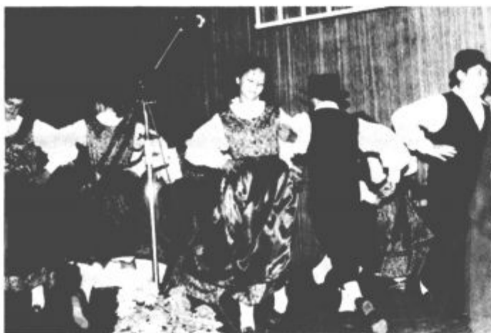
Med nastopom folklorne skupine Osnovne šole Braslovče.