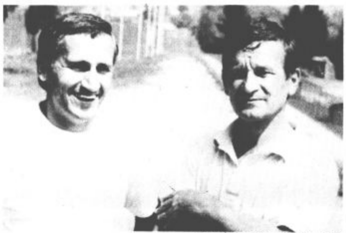
Ta smieh ni od nedelje (vos)

Gostje so se uspešno branili in le občasno napadali. V drugem delu je bila igra enakovredna, vendar so se gostje še bolj zaprli, v dveh protinapadih pa dvakrat zadeli. S tema točkama so igralci Korotan Suvcla že bliže obstanku, Šmarčani so ostali na 9. mestu, s porazom pa zamudili priložnost za napredovanje.