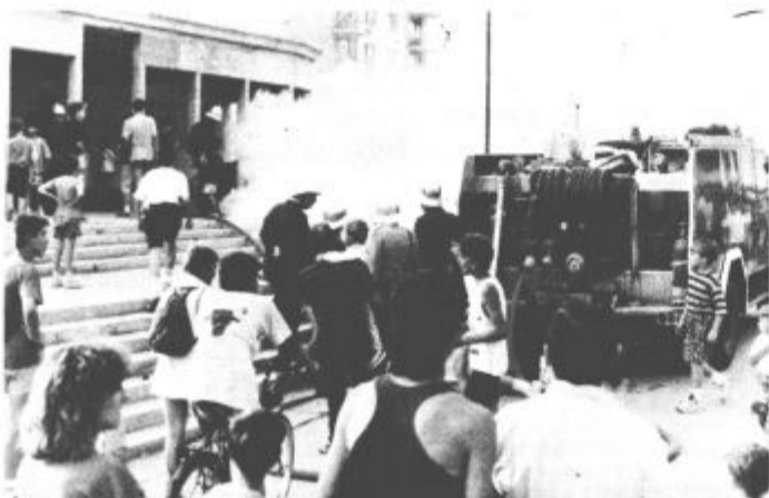
Vaja je bila zanimiva, saj so gasilci prikazali veliko sodobnih pripomočkov za gašenje požarov in različnih načinov reševanja

V večernih urah so nato, v delno že prenovljenem domu, pripravili svečano sejo na kateri so ocenili prehojeno pot in nakazali bližnje cilje, med katerimi sta najpomembnejša obnova gasilskega doma in nakup novega vozila. Najzaslužnejšim gasilcem so ob tej priložnosti podelili tudi priznanja, priznanja pa so podelili še vsem tistim, ki so jim v zadnjem času