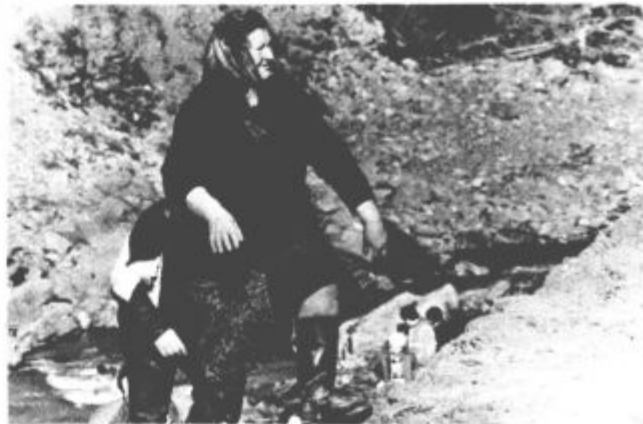
Do kdaj tako