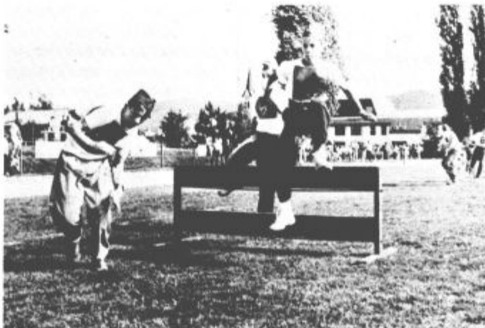
Med nastopom mladinske desetine Gomilskega, ki je bila druga na ovirah.