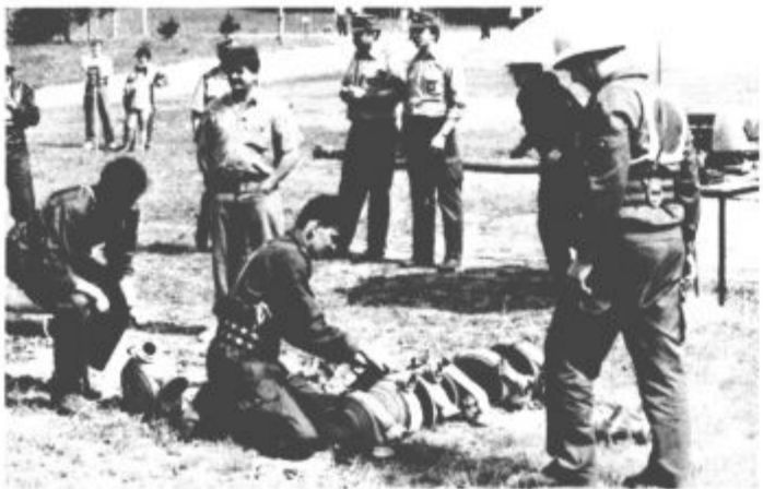
Že sedaj eno največjih gasilskih tekmovanj, tekmovanje za pokal Šaleške doline, privablja vsako leto več gasilskih desetih