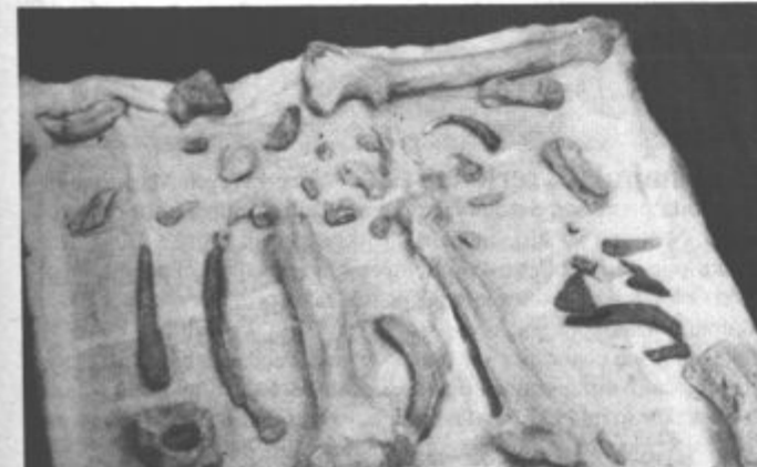
Pisne izdelke so učenci dopolnili z ustnimi razlagami, s sliko in predmeti; tudi s kostmi jamskega medveda izpod Olišev

To je pokazala predstavitev njihovih nalog pred nedavnim v Galeriji moziškega kulturnega doma. Nalog je bilo letos veliko, raziskovalci pa so predstavili po dve z vsake ob štirih osemletkih. Dokaz za "višek" je obsežen in pomemben projekt z naslovom "Šumijo gozdovi domači" moziške osemletke z obema podružničnima šolama v Nazarjah in na Rečici, ki ga tokrat niso predstavili, prav vsi učenci pa so gozd proučili v vseh njegovih življenjsko pomembnih razsežnostih.