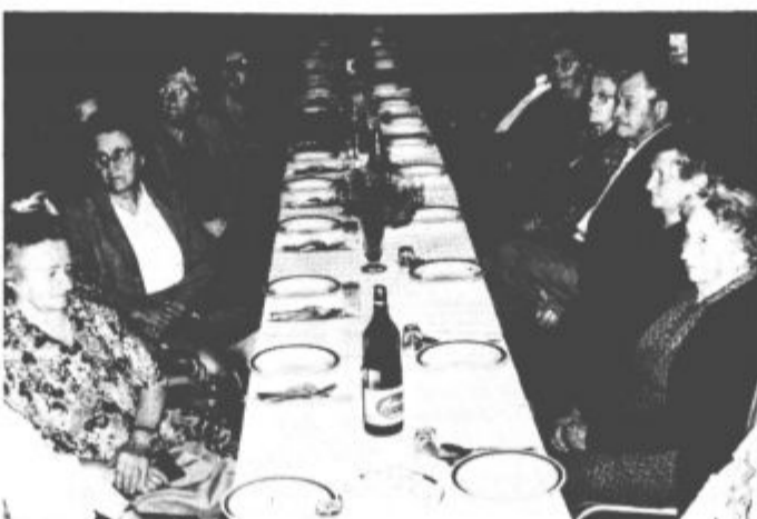
Del udeležencev nedeljskega srečanja krajanov starih sedemdeset in več let v Braslovčah.