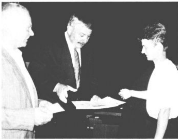
Med podelitvijo priznanj

V desetih letih je več kot petsto mladih, največ je bilo učencev Centra srednjih šol, izdelalo kar 250 raziskovalnih nalog. Mnoge so bile predstavljene tudi v državnem merilu, mnoge so takšne, ki so jih podjetja s pridom uporabila v proizvodnji, spet druge so pomagale pri razjasnitvi naše preteklosti in polpretekla zgodovine....Na letošnjem natečaju je sodelovalo 52 mladih, izdelali pa so 32 raziskovalnih nalog, pri delu pa jim je pomagalo 32 mentorjev in 45 recenzentov. Devet nalog je bilo takšnih, da jih je posebna strokovna komisija posebej nagradila. Ob desetletnici pa so se za sodelovan-