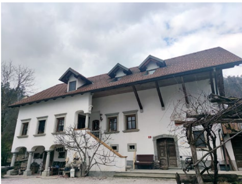
Obnovljena domačija danes.

Z ženo nama velike hiše sicer nikoli niso bile všeč, najina, s kar nekaj prizidki, toliko manj. A potem sva si začela ogledovati stare gorenjske kmečke in meščanske hiše in neka se nama je priljubila misel, da bi najino uredila v tradicionalnem slogu, z okenskimi obrobami v zelenem tufu, s stebri, zunanjim stopniščem ... Izkazalo pa se je, da hiša nima niti ustreznih temeljev in da so gradbene plošče še lesene ter da bo pot do