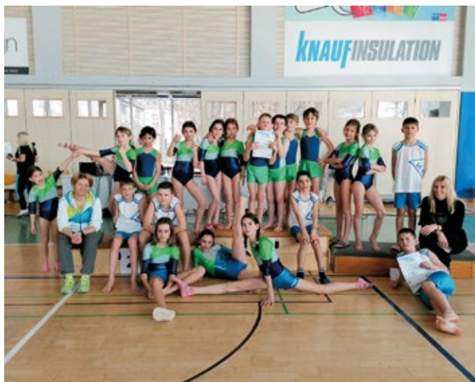
Ekipa OŠ Vodice na tekmovanju v skokih na mali prožni ponjavi