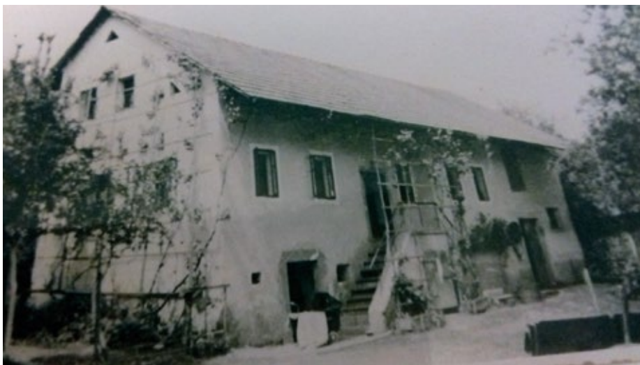
Prvi zapisi domačije 'Pr Mkvavžovc' segajo v leto 1832, prvi posnetek pa je iz leta 1939.

Zgodba o obnovi domačije Čebaškovič iz Repenj je ena tistih, ki navdihuje in se ob pogledu nanjo razveselimo, zato smo jih zaprosili, da nam na kratko povedo, kako so se dela lotili in zakaj: »Rojstna hiša moje mame je naš dom postal bolj po naključju, ko sem od soseda izvedel, da dedek eno polovico prodaja, druga pa je že bila v mamini lasti, ki je skrbela za babico. Imel sem možnost pridobiti kredit in sem jo izkoristil, ker se mi je milo storilo ob misli, da bi šlo imetje prednikov v tuje roke.