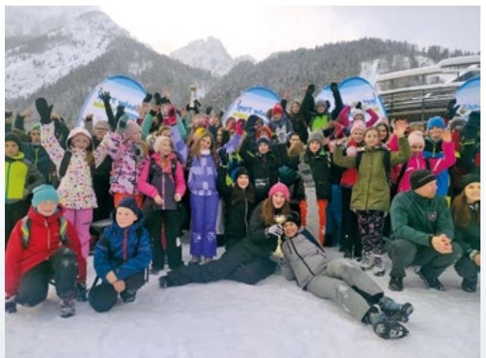
Šolski Planiški maraton