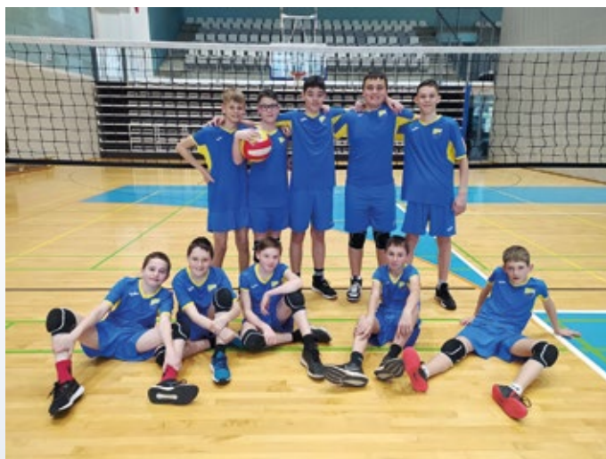
Ekipa OŠ Vodice v mali odbojki