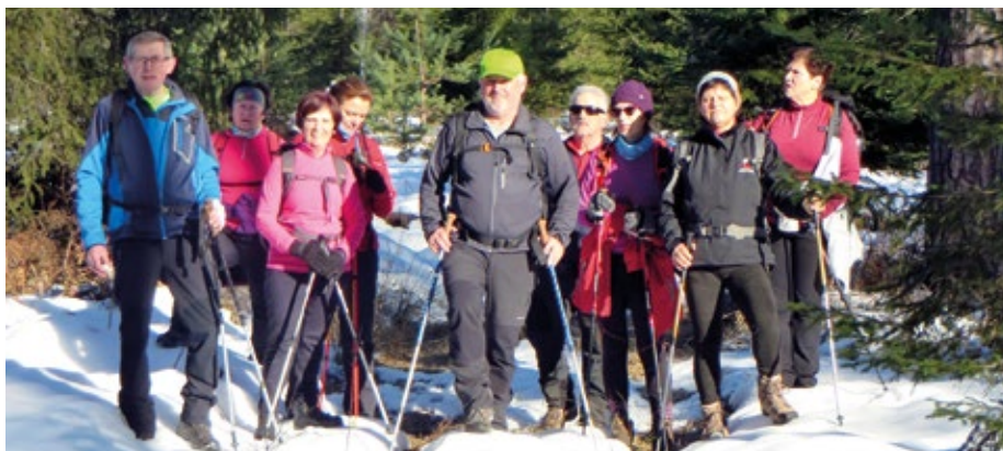
Pohodniki v zasneženi gmajni proti Šmarni gori

Pot nas je vodila iz Vodice skozi Medvode do Sore, kjer smo zavili v dolino Ločnice. Na parkirišču ob cesti pri domačiji Legastja smo parkirali vozila in se usmerili po cesti proti Govejku oziroma Mihelčičevemu domu na Govejku (734 m). Dom je bil zaprt, zato smo pot nadaljevali levo v breg na Gontarsko planino (894 m). Lepa, suha in lepo speljana pot nas je kmalu pripeljala na vrh, kjer smo se ustavili in se razgledali po bližnjih vrhovih, kot sta Grmada in Tošč, in vse tja do Krime in vrhov nad Ljubljanskim barjem. Sledil je kar strm spust, za dobrih sto višinskih metrov, do ceste, ki iz Ločnice pripelje v zaselek Osolnik. Sledili smo oznakam do vrha nad Osolnikom, kjer kraljuje cerkev sv. Mohorja in Fortunata (858 m). Okoli cerkve, od koder je prav lep razgled na vse strani, je tudi večje število klopi za pohodnike. Ker je rahlo pihal, smo si poiskali klopce v zavetrju ob cerkvi. Sledila sta krajši počitek in okrepčilo, nato pa pogled po bližnji in daljni okolici. Čeprav je bilo sončno vreme, ozračje