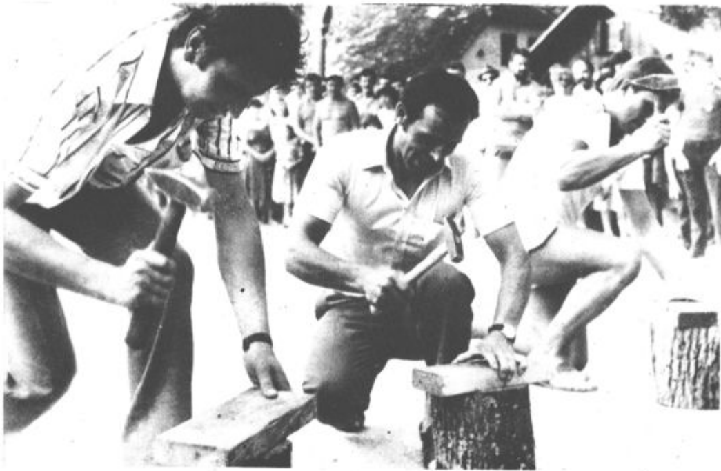
Novinarji Dela so s svojo akcijo Poletje 84 lepo popestrili program. Zanimanje za tekmovanje je bilo veliko, smeja tudi, da o bogatih nagradah ne govorimo

na naslov: MLADINSKA KNJIGA, Trgovski center 63320