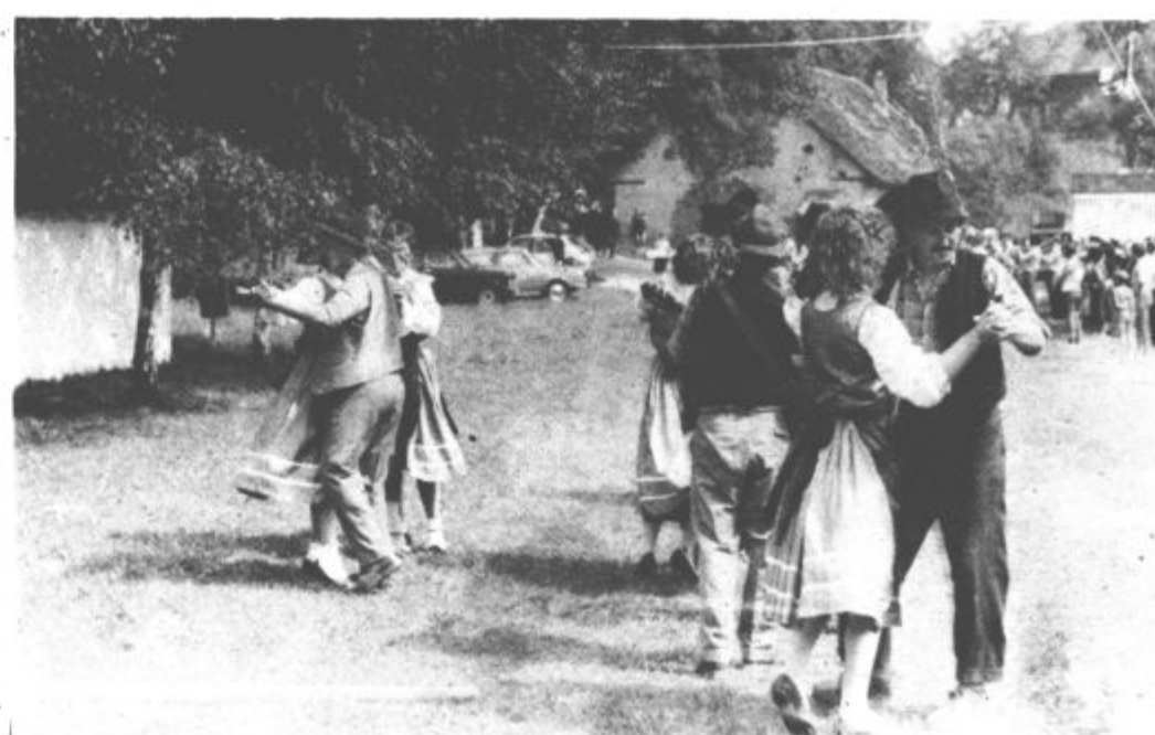
Pred odhodom na rajžo so flosarji tudi zaplesali s svojimi izbrankami