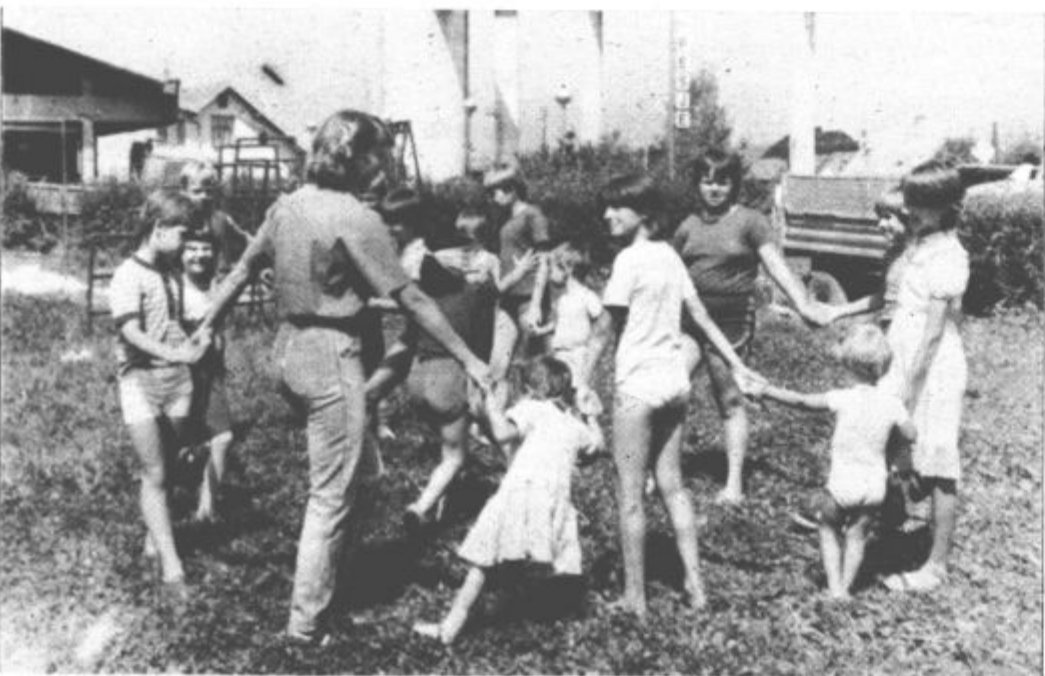
Otroci pri igri

Nekateri iz raznih materialov izdelujejo najrazličnejše izdelke, ki so včasih prav domiselni in ljubki, drugi pa prebirajo knjige, ki so primerne za njihovo starost, posodila pa nam jih je občinska zveza društev prijateljev mladine. Glede na to, da je zanimanje za počitniško varstvo v Pesjem vsako leto večje, bi ga kazalo v prihodnje razširiti na dve skupini, za predšolske in šolske otroke. To bi bilo potrebno predvsem zato, ker je med otroki različnih starosti, tudi različno zanimanje za igre in druge aktivnosti.«