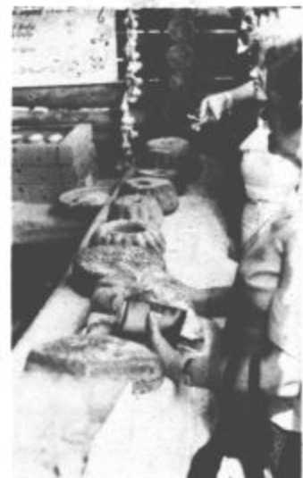
Posebno pozornost so med obiskovalci pritegnile stojnice, na katerih so kmečke žene predstavile (in tudi prodajale) izvorne domače jedi. Zares so bile dobre!