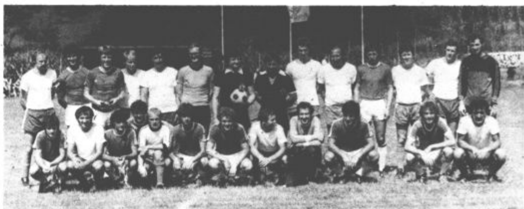
Tudi nogometaši domačega Gradbenika vsako leto obeležijo bal s pokalnim srečanjem. Tokrat so bili njihov nasprotnik nogometaši Smartnega, rezultat pa presenetljivo visok za domačine. Okrepljeni domačini so namreč premagali oslABLJENE goste kar s 5:0.