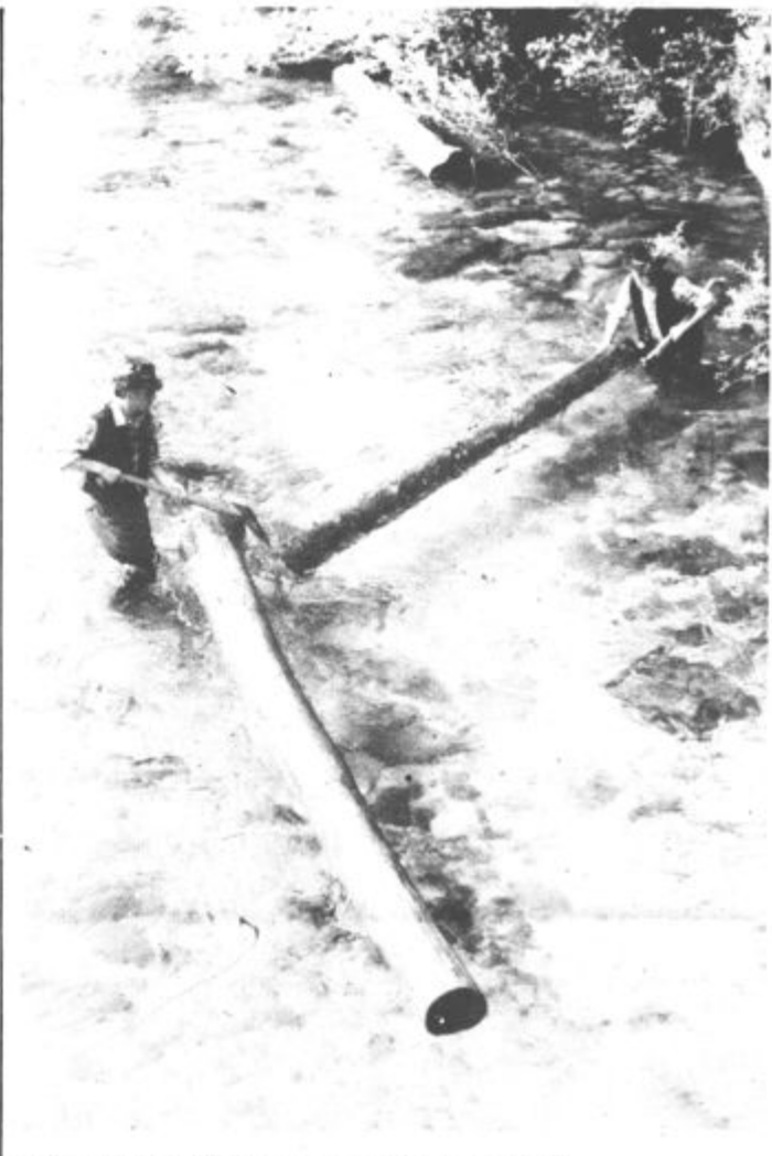
Tudi prikaz plavljenja lesa po Savinji je bil zanimiv