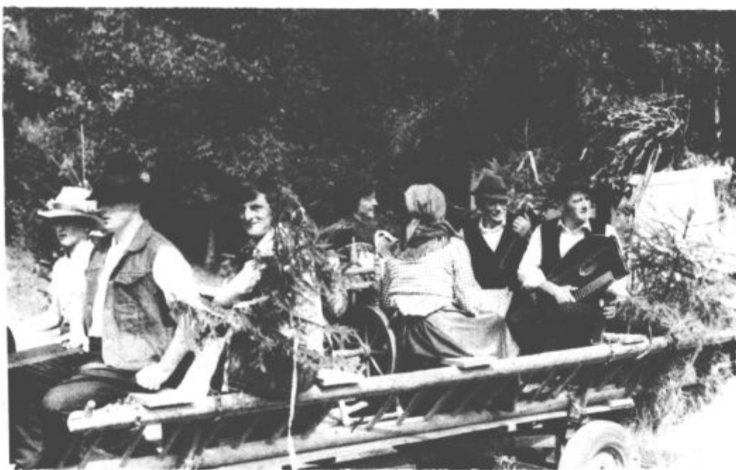
S povorko so želeli prikazati utrip kraja nekoč in danes