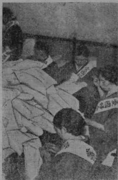
Japonke pripravljajo v domovini za na Kitajskem se vojskujoče vojake razna darila.