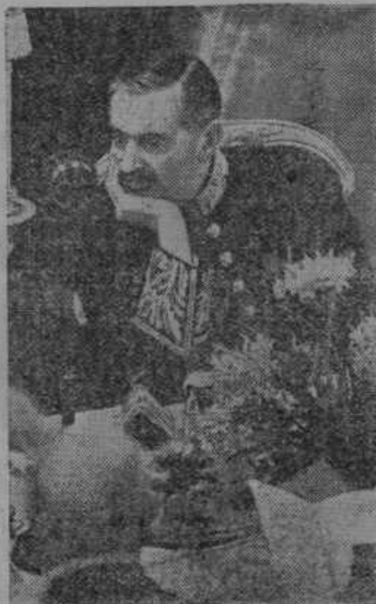
Angleški ministrski predsednik Chamberlain v zgodovinski obleki pri slavnostnem obedu ustoličenja novega londonskega župana.