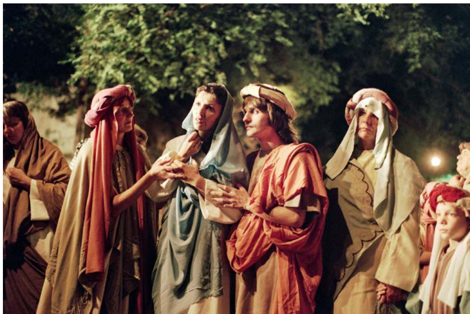
Jezusova mati Marija. Križev pot v San Isidru, foto Marko Vombergar.

Vabilo na Živi križev pot, objavljeno v tedniku Svobodna Slovenija, 30. marec 1995.