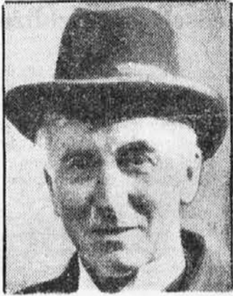
Sir John Simon, voditelj angleških narodnih liberalcev