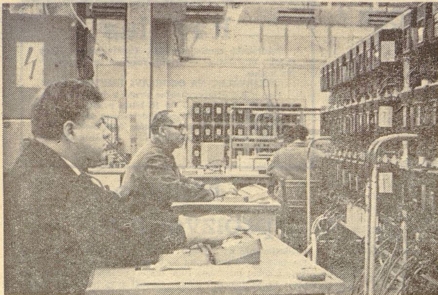
Iz oddelka za kontrolo števec v kranjski tovarni